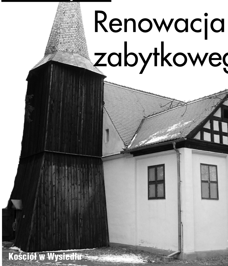
Kościół w Wysiedlu

(ŁOBEZ) Decyzją burmistrza Łobza Parafii Rzymskokatolickiej pw. Najświętszego Serca Pana Jezusa z Zajeziera przekazano, że środków na zabytki, kwotę 1.500 zł na wykonanie dokumentacji technicznej dotyczącej renowacji ołtarza kościoła w Wysiedlu.