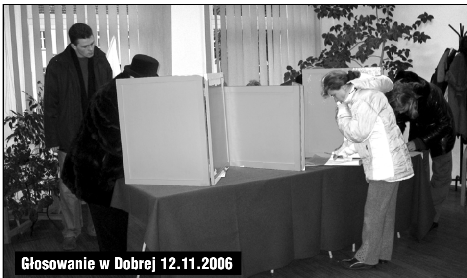
Głosowanie w Dobrej 12.11.2006

(DOBRA) Sześć komitetów wyborczych zakwestionowało wynik wyborów w Dobrej i wspólnie podpisało się pod protestem wyborczym złożonym w Sądzie Okręgowym w Szczecinie. Ten 20 grudnia rozpatrzył protest i uznał go za bezpodstawny.