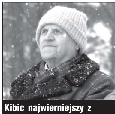
Kibic najwierniejszy z

Kilka dni temu przybysz z Francji poprosił mnie o współpracę w wyszukiwaniu na naszym terenie młodych piłkarzy do francuskich