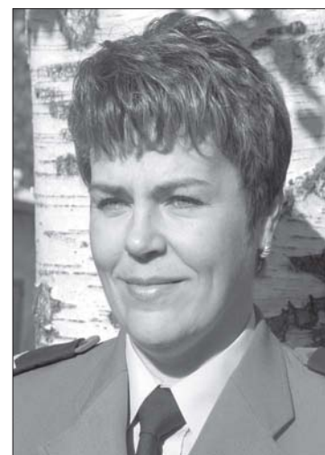
Sporządziła mł. asp. Anna Młynarczyk. Tytuły od redakcji.

(WIERZCHOWO) W dniu 10.01.2008 r. o godz. 19:10 w Wierzchowie, przy ul. Długiej, doszło do wypadku drogowego. Kierujący samochodem osobowym 34-letni mieszkaniec Wierzchowa,