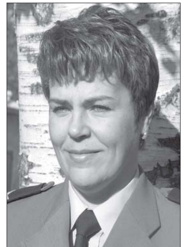
Sporządziła mł. asp. Anna Młynarczyk. Tytuły od redakcji.

(ZŁOCIENIEC) 19.01.br., o godz. 7:30 w Złocięncu, przy ul. Czaplincekiej, 34-letni mieszkaniec Złocięńca kierując samochodem osobowym marki OPEL VECTRA podczas manewru wyprzedzania ciągnika rolniczego nie zachował należytej ostrożności i czołowo zderzył się z prawidłowo jadącym samochodem osobowym marki VOLVO. W wyniku zdarzenia kierująca VOLVO 34-letnia mieszkanka Złocięńca doznała złamania prawej ręki, natomiast pasażerowie samochodu OPEL VECTRA 35-letni mężczyzna doznał stłuczenia głowy oraz ogólnych potłuczeń i 58-letnia kobieta doznała stłuczenia głowy i złamania kręgosłupa lędźwiowego. Wszyscy poszkodowani przewiezieni zostali do szpitala powiatowego w Drawsku Pom.