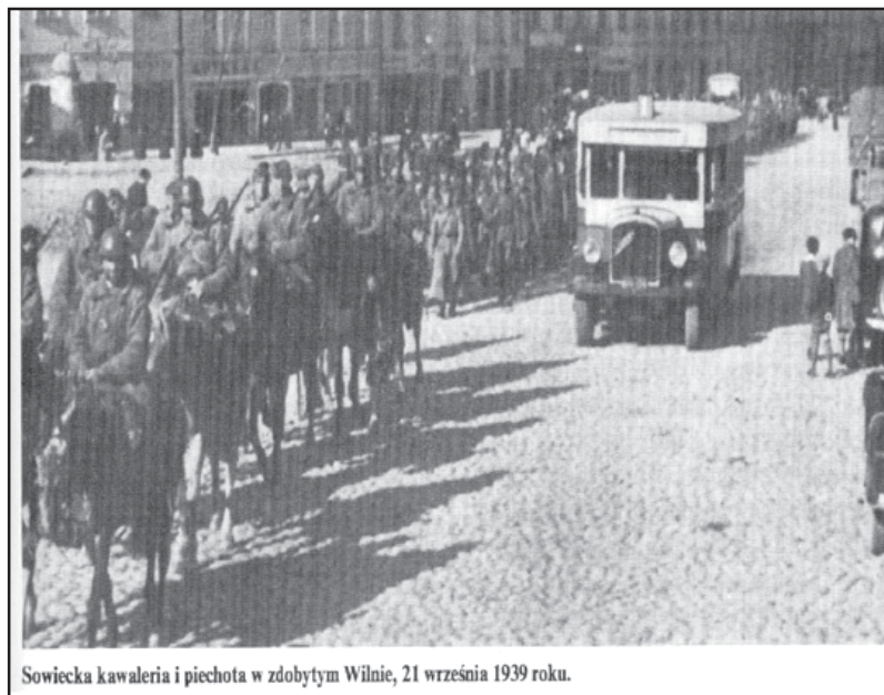
Sowiecka kawaleria i piechota w zdobytym Wilnie, 21 września 1939 roku.

niemieckie dopuszczały się wcześniej w latach 1941-1944 w ZSRR.