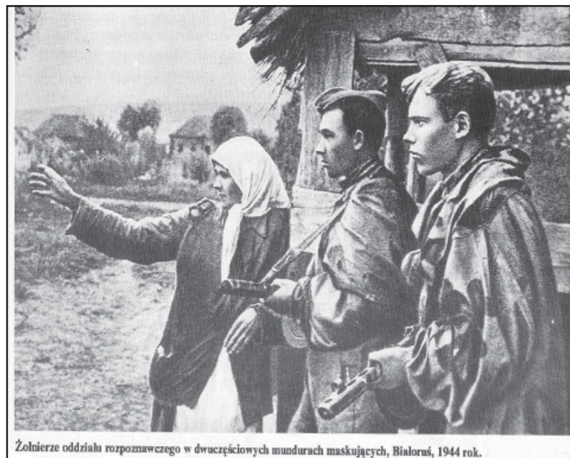
Żołnierze oddziału rozpoznawczego w dwuczęściowych mundurach maskujących, Białoruś, 1944 rok.

Wojska sowieckie użytkowały dwa folwarki miejskie o powierzchni 67 i 225 hektarów. Zatrudniona do pracy tam była ludność niemiecka. Osoby te nie były zarejestrowane w biurze meldunkowym, co powodowało duże trudności w procesie wysiedlania Niemców w listopadzie 1945 r. Niemki pracowały w domach oficerskich jako kucharki i służące. Stosunek ludności polskiej do wojsk radzieckich uległ gwałtownemu zaostreniu, po zamordowaniu żołnie-