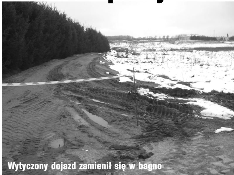
Wytyczony dojazd zamienił się w bagno

(DRAWSKO POM.) Budowanie kanalizacji to rzecz chwalebna, ale nie zawsze. Przekonali się o tym mieszkańcy ul. Ł'kowej w Drawsku Pomorskim, którym odcięto dojazd do domów. Z'orzecz', zostawiają samochody w centrum i modlą się o to, by nic z'ego się nie zdarzyło, bo nie dojedzie karetka lub straż pożarna. Znosi się na długie godziny, bo blokada ulicy może potrwać kilkanaście miesięcy, a nawet lat.