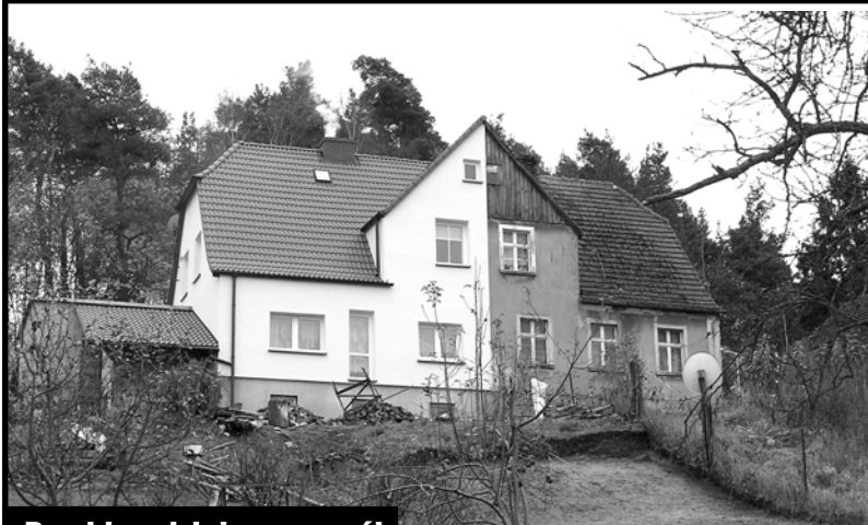
Domki podzielone na pół