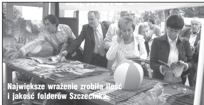
Największe wrażenie zrobiła ilość i jakość folderów Szczecinka

Przewodnikami w tej wycieczce byli pracownicy wydziałów promocji gmin i powiatu. Zakończenie obchodów odbyło się na zamku w Starym Drawsku.