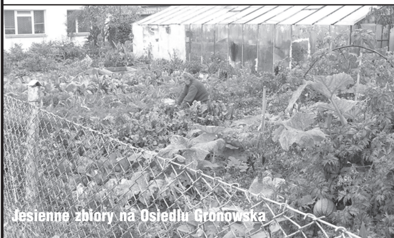
Jesienne zbiory na Osiedlu Gronowska