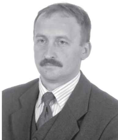
zgłosi zastrzeżeń do osoby kandydata.