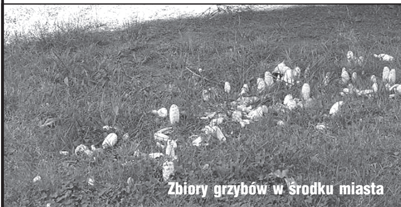
Zbiory grzybów w środku miasta