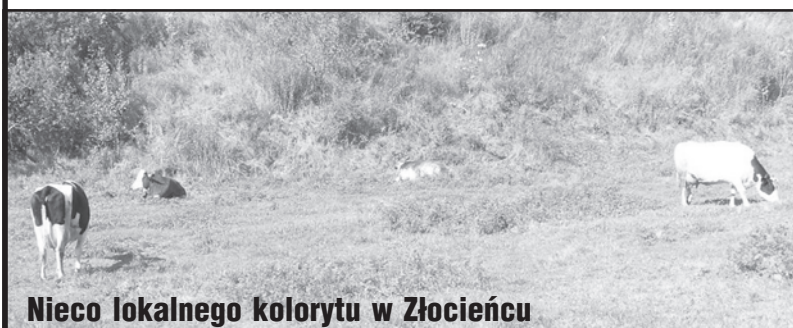
Nieco lokalnego kolorytu w Złocięncu