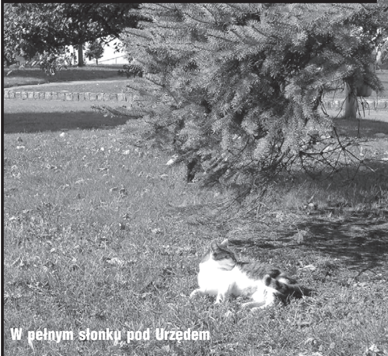
W pełnym słońku pod Urzędem