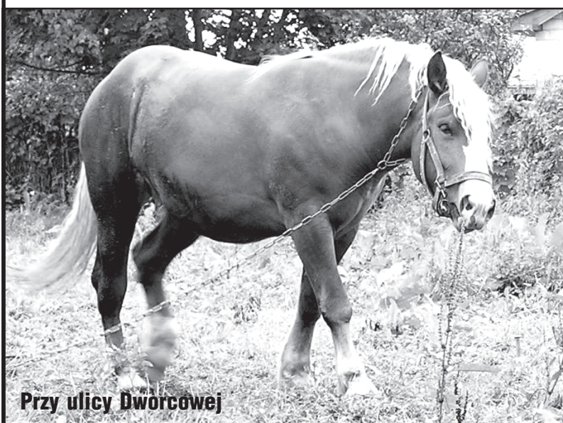
Przy ulicy Dworcowej