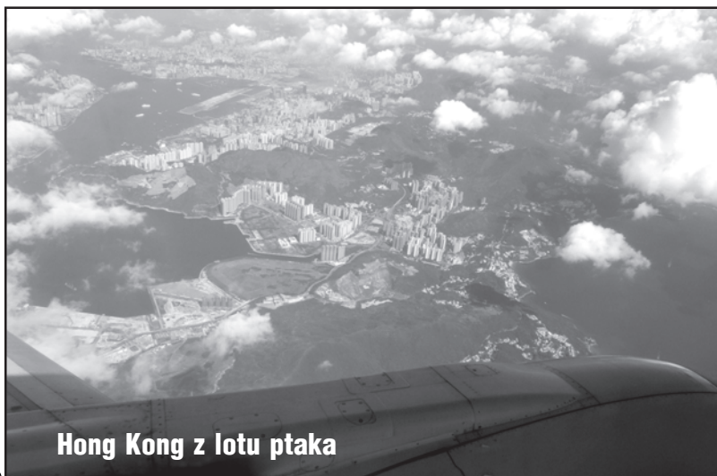
Hong Kong z lotu ptaka