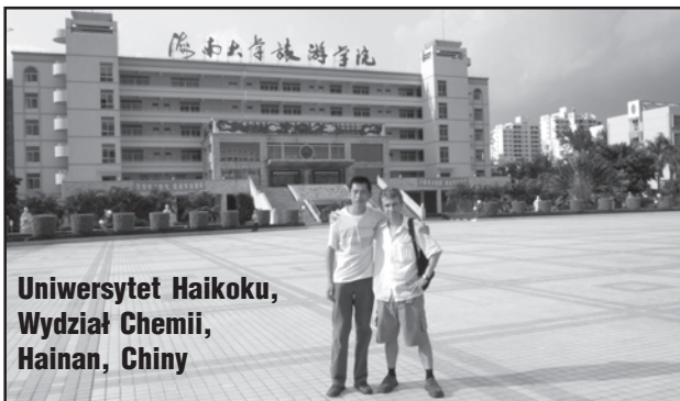
Uniwersytet Haikoku, Wydział Chemii, Hainan, Chiny