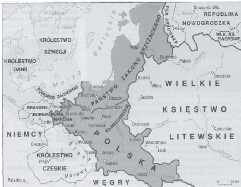
Polska, Litwa i państwo zakonu krzyżackiego na początku XV wieku