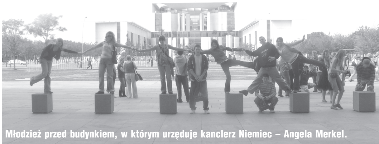
Młodzież przed budynkiem, w którym urzęduje kanclerz Niemiec – Angela Merkel.