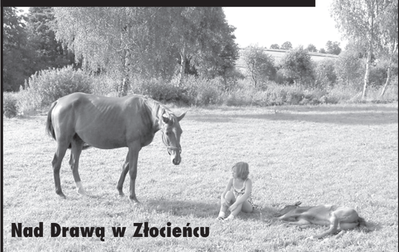
Nad Drawą w Złocięcu