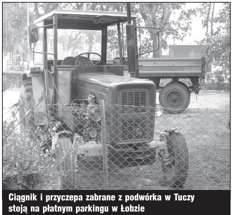
Ciągnik i przyczepa zabrane z podwórka w Tuczy stoją na płatnym parkingu w Łobzie