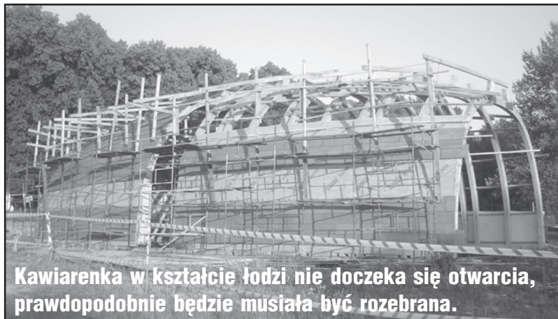
Kawiarenka w kształcie łodzi nie doczeka się otwarcia, prawdopodobnie będzie musiała być rozebrana.