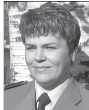
Sporządziła mł. asp. Anna Młynarczyk. Tytuły od redakcji.

(DRAWSKO POM.) 4.08.2007 r. o godz. 15:17 w Drawsku Pom. policjanci KPP zatrzymali dwóch mieszkańców Drawska Pom. w wieku 17 i 20 lat podejrzanych o dokona-