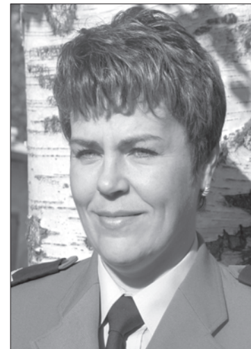
Sporządziła m 3 . asp. Anna M 3 ynarczyk. Tytuł z redakcji.

GOŚCINNY DOM (WIERZCHÓWKO) W dniu 4.07.2007 r. o godz. 22:00 w miejscowości Wierzchówko, gmina Wierzchowo, 17-letni mieszkaniec powiatu drawskiego, wykorzystując sen domowników z niezamkniętego mieszkania dokonał kradzieży portfela z pieniędzmi. Pokrzywdzona mieszkanka Wierzchówka oświadczyła, że w portfelu znajdowało się 760 zł.