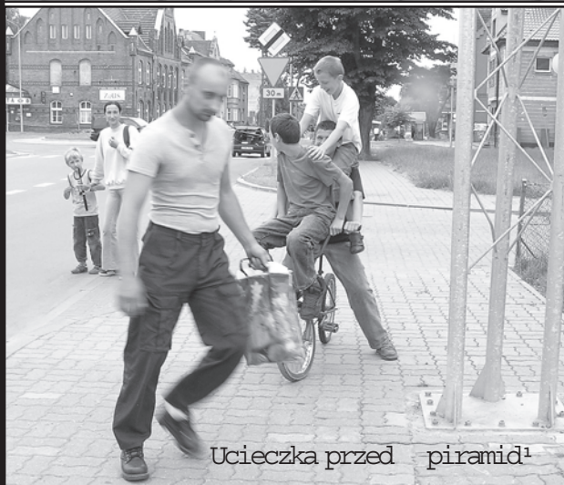
Ucieczka przed piramid 1