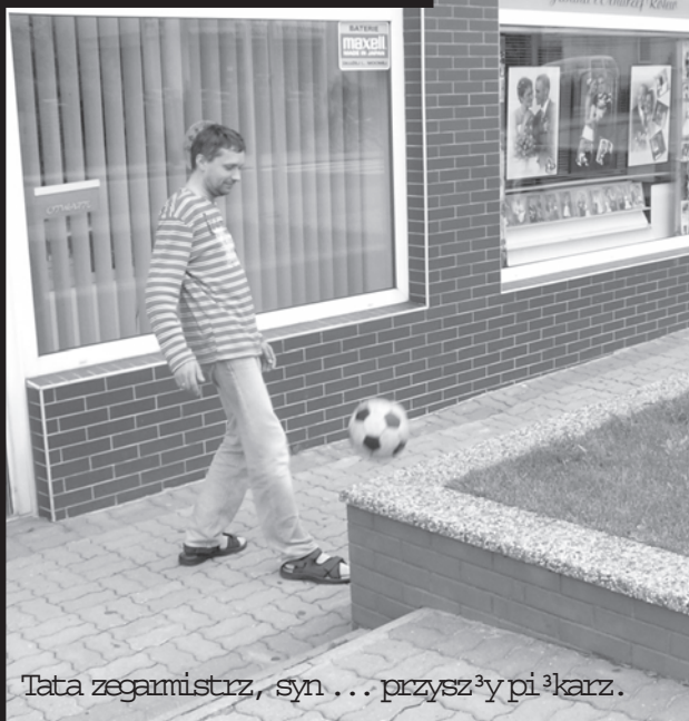
Tata zegamistrz, syn ... przyszły piłkarz.