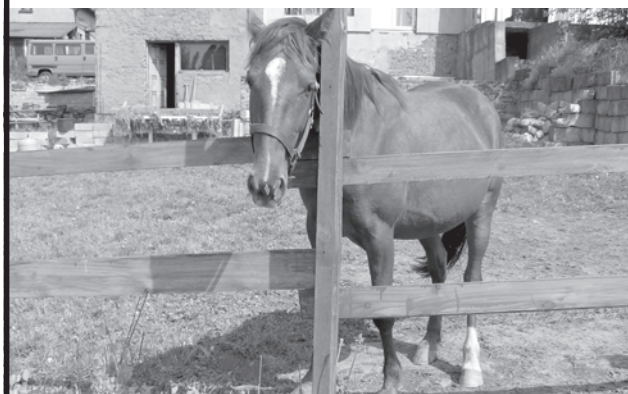
Przy ulicy 11 Listopada w Złocięncu w oczekiwaniu na potomstwo