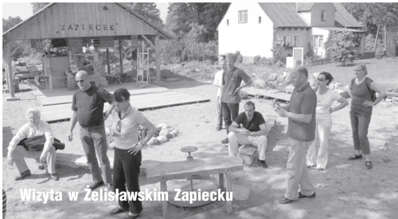
Wizyta w Żeliszawskim Zapiecku

W ramach współpracy zagranicznej Starostwo Powiatowe w Drawsku Pomorskim w dniach od 21 – 22 maja 2007 roku gościło dziesięcioosobową delegację z regionu Mecklenburg - Vorpommern: Feldberger Seenlandschaft i Uckermark Seen.