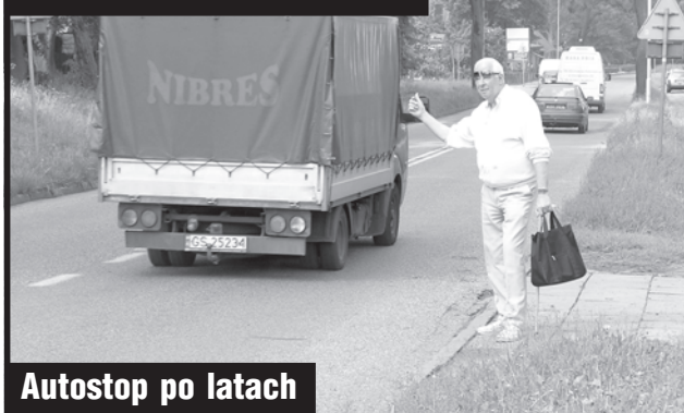
Autostop po latach