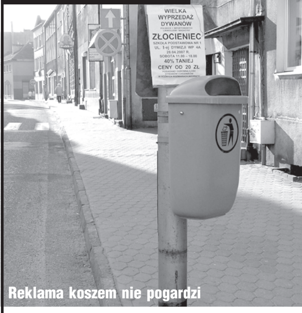
Reklama koszem nie pogardzi