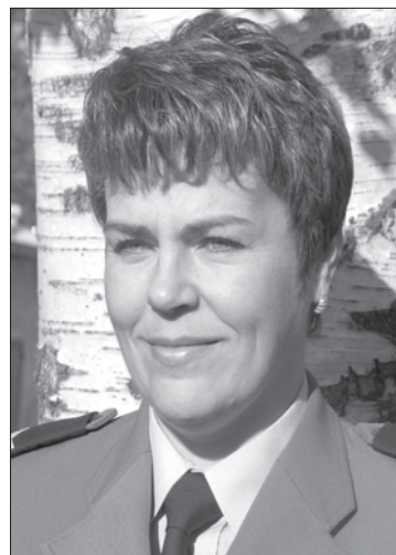
Sporządziła mł. asp. Anna Młynarczyk. Tytuły od redakcji.

W dniu 26.04.2007r. o godz. 16:05. w Złocieniu przy ul. Mickiewicza policjanci podczas kontroli drogowej samochodu osobowego marki OPEL KADETT ujawnili, że kierujący 51-letni mieszkaniec Drawska Pom. znajduje się w stanie nietrzeźwości. Przeprowadzone na miejscu zdarzenia badanie na zawartość alkoholu w wydychanym powietrzu wykazało 2,14 promila. W trakcie dalszych czynności funkcjonariusze ujawnili, że mężczyzna kierował pojazdem mimo, iż miał sądowy zakaz kierowania wszelkimi pojazdami mechanicznymi nałożony na niego przez Sąd Rejonowy w Drawsku Pom. w 2006 roku.