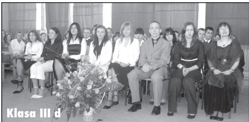
Klasa III d