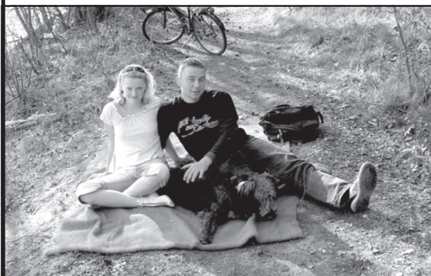
W lasku na piasku