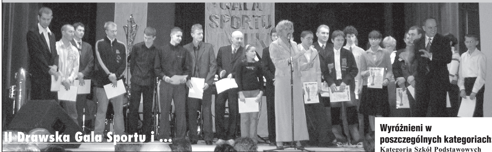
II Drawaska Gala Sportu i ...