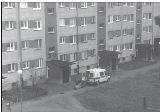
Chory doczekał się pomocy.