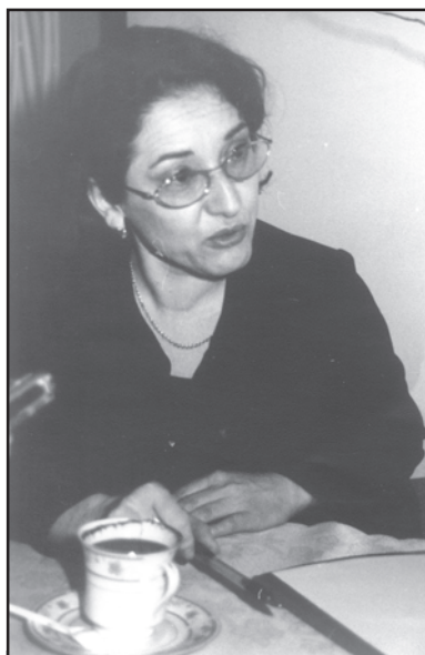
Panowie, to co mówicie, jest tragiczne