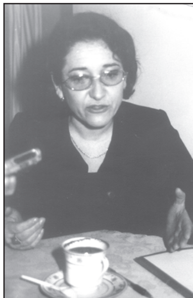
Proszę napiszcie, że sprawy opieki społecznej są zapisane w Ustawie o Samorządzie