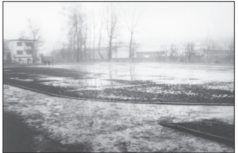
To jest to!

Za tydzień niewiarygodne zdjęcia obiektów sportowych w miejscu nowej pracy radnego wuefisty. Zaplecze sportowe Szkoły Podstawowej nr 1 i