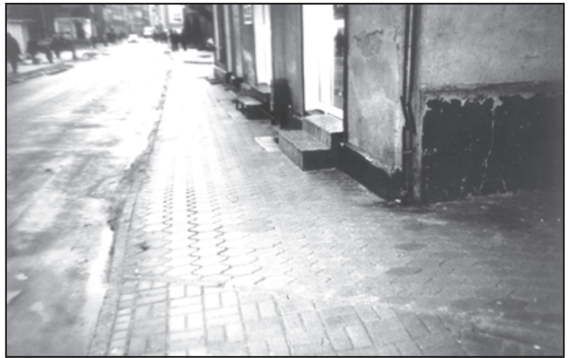
Oblodzona pochyłość chodnika na Słodkim Rogu

się woda i zamarza lub tylko ścieka po pochyłości do rynsztoka. Pochyłość staje się niebezpiecznie śliska i nieszczęścia gotowe.