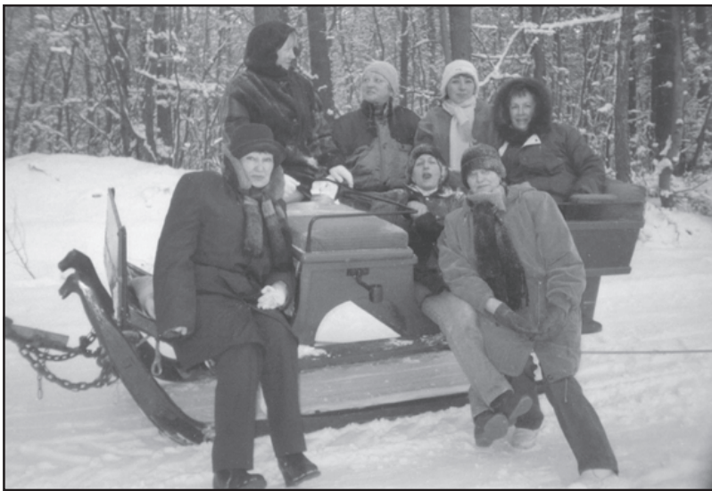
Na stylowych saniach. W tle – lubieszewska knieja zimą

Przewodnim celem Koła jest aktywizacja i promowanie kobiet w życiu społecznym, gospodarczym i kulturalnym oraz rozwój różnych form samokształcenia w celu podniesienia kwalifikacji zawodowych, jak również dostęp do oświaty.