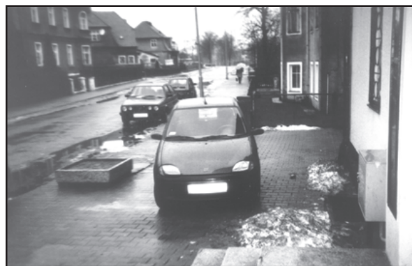
"Co je moje, to je moje"

cyjnym dla pieszych. Jest zaparkowany tak, aby - na miarę swoich skromnych możliwości - jak tylko się da utrudnić im poruszanie się. Wychodzący gremialnie z budynku, przy którym ten samochód parkuje, a chcący udać się w prawo, wychodzą w związku z tym na jezdnię. Także dzieci. Dlaczego widoczne dalej dwa samochody parkują na ulicy? - ich kierowcy wiedzą, że tak właśnie parkować należy.