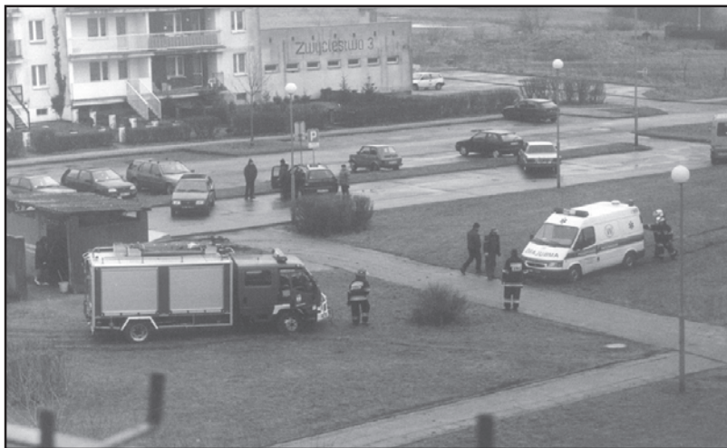
Karetką pogotowia musiała wjechać na trawnik

spójrzmy raz jeszcze, czy zaparkowaliśmy dobrze, czy czasem nie jesteśmy swoją maszyną zawalidrogą dla kogoś, do kogo wezwano karetkę. Zwyczajnie