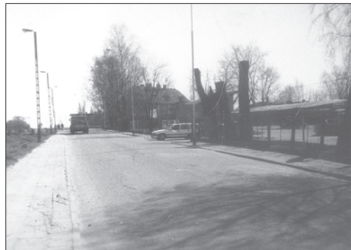
Teraz to już krajówka

zostawienia kategorii drogi zaliczanej do kategorii dróg gminnych. Idzie tu o odcinek drogi gminnej, ulicy Drawskiej, od ulicy Mirosławieckiej