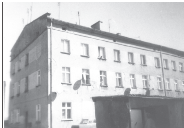
Budynek przy ulicy Stolarskiej 9

Największym problemem trapiącym ZGM jest tzw. windykacja należności. Bezrobocie, brak pieniędzy na codzienne życie, ciągłe ubożenie społeczeństwa powodują