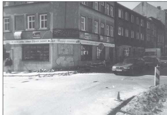
Ruch utrudniony, ale już za kilka dni będzie po wszystkim

To miejsce w mieście wymagało szczególnej staranności także i z tego powodu, że chodniki tu położone jakby nie wytrzymały