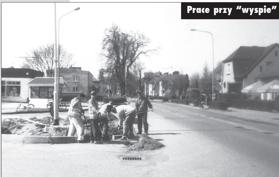
Prace przy "wyspie"

(ZŁOCIENIEC) Kierowcy wjeżdżający na Osiedle Czaplincekie od strony ulicy Wyzwolenia i tędy wyjeżdżający na ulicę Czaplinceką zauważyli ekipę pracowników Zakładu Usług Komunalnych remontujących wysepkę okalającą zainstalowany tu słup oświetleniowy. Wysepka jest szczególnie ważna w tym miejscu, gdyż stanowi czytelne odniesienie dla korzystających z tych dwóch ulic, w tym szczególnie dla nasilającego się ruchu na ulicy Czaplincekiej. Liczą się przecież także walory estetyczne wjazdu do miasteczka z turystycznymi ambicjami. (r)