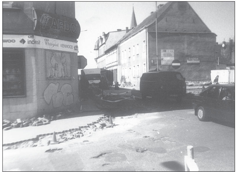
Jak podczas kręcenia filmu "Kierunek Berlin"

próby czasu. W czasie zimy narzekania na ich stan techniczny nasiliły się