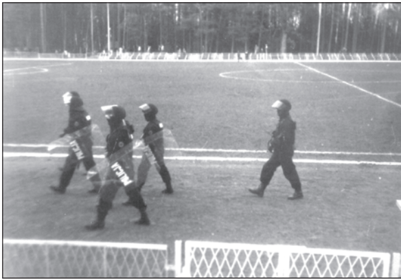
Policjanci na Stadionie Leśnym w Złocieniu

(ZŁOCIENIEC) Organizatorzy meczu piłkarskiego o mistrzostwo piątej ligi grupy południowej między Olimpem Złocieniec a Wielimem Szczecinek, widowiska organizowanego w Złocieniu, nie po raz pierwszy stanęli przed zadaniem przestającym siły skromnego Klubu. W sukurs pospieszyła policja, gdyż spodziewano się, że na stadionie Olimpu, akurat przy okazji tego meczu, może dojść do wydarzeń, które nie tylko, że mogłyby wymknąć się spod kontroli nielicznych cywil-