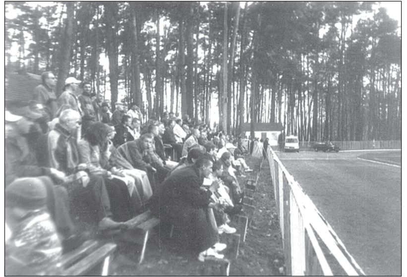
Liczna publiczność na połamanych trybunach

W Olimpie w miejsce Marcina Czeszczewika wszedł Łukasz Żych.