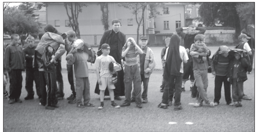
Na koniec niebo pokropiło wszystkich uczestników