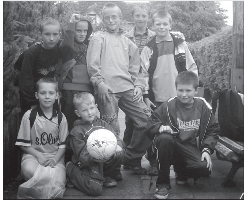
Młodzież z Zarańska grać w piłkę potrafi