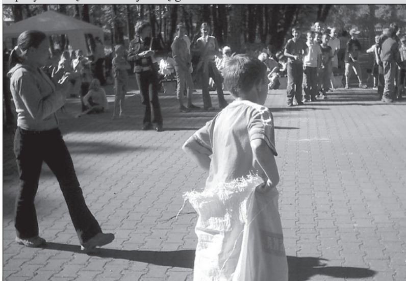
Podczas tej konkurencji było najwesелей