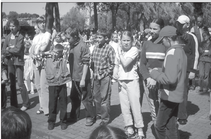
Zabawa trwała w najlepsze