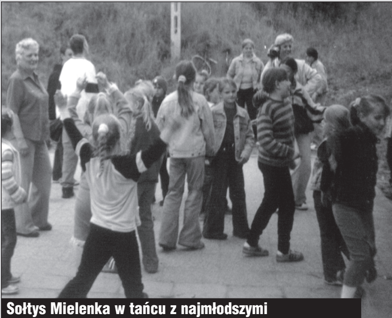
Sołtys Mielenka w tańcu z najmłodszymi