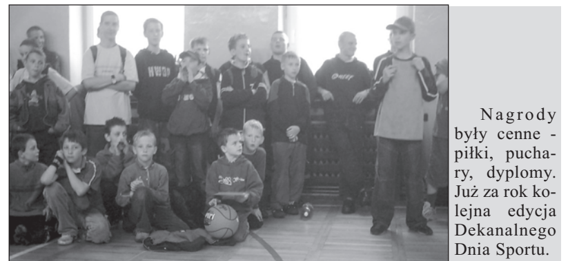
Nagrody były cenne - piłki, puchary, dyplomy. Już za rok kolejna edycja Dekanalnego Dnia Sportu.