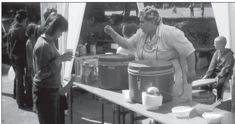
Sporym wzięciem cieszyła się grochówka