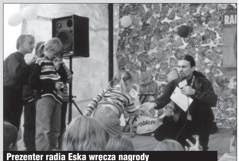
Prezenter radia Eska wręcza nagrody