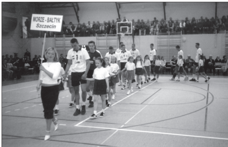
Złocieniecka hala już jak malowana

już przed godziną dziewiątą rano. Rozpoczęto mecze towarzyskie za-