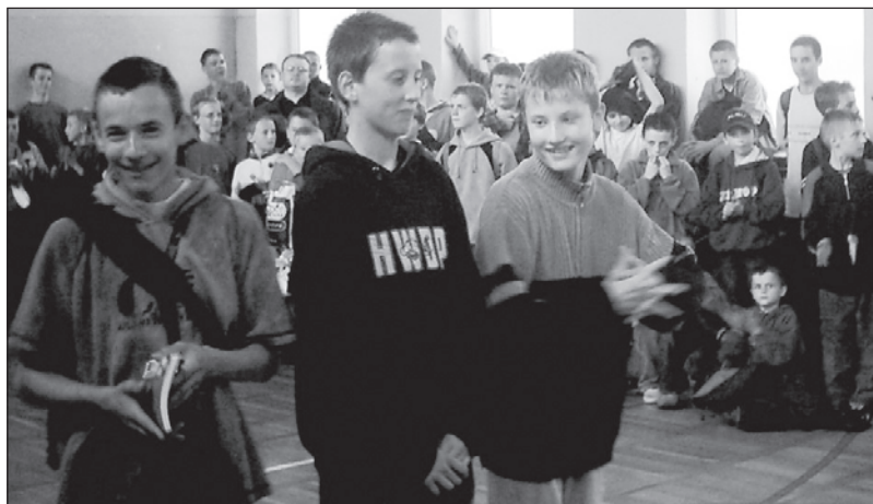
Co na to rodzice, księża, wychowawcy?

Szczerze mówiąc, nie potrafię odpowiedzieć na te pytania, gdyż dotyczą one wielu ludzi, i każdy sam musi sobie na nie odpowiedzieć. Jednak nasuwa się wniosek, że jako społeczeństwo często udajemy, że problemu nie ma. Nie chcemy widzieć, więc odwracamy głowę. Czy tak ma być? Dziś sygnalizujemy problem postaw wśród młodzieży, postaw które zadecydują o ich przyszłym życiu.