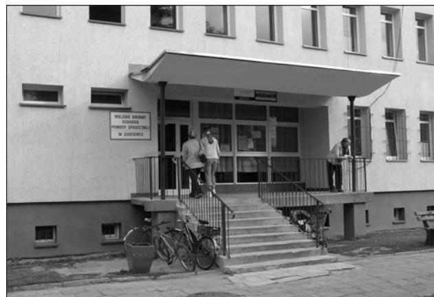
Siedziba Opieki Społecznej w Złocienku przy Placu 650 – lecia Miasta

Złocienieccy bezdomni przy tej okazji pytają, czy i im Rzeczpospolita Polska może w drodze ustawy przyznać takie dodatki i czy otrzymają je wraz z „zupką” w miejscowej Opiece? (o)