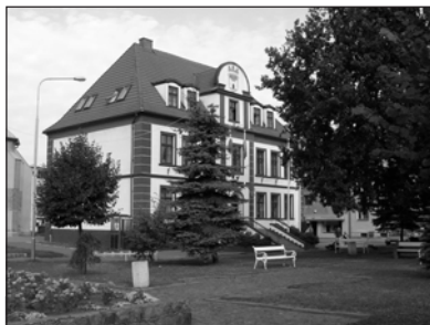
Pałacyk Urzędu Miasta w Złocieniu

(ZŁOCIENIEC) Przyjęty uchwałą Rady Miejskiej w Złocieniu budżet gminy zakładał dochody w wysokości 21.535.338 złotych, a wydatki to 25.313.468 złotych. Budżet gminy zamykał się deficytem w wysokości 3.778.130 złotych.