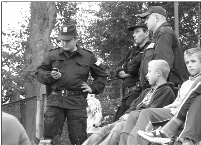
Na trybunach było spokojnie