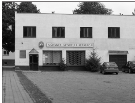
Tu czeka biurko na nowego dyrektora OSiR.

Stan środków pieniężnych na rachunku bankowym na dzień 30 czerwca 2004 roku wynosił 125 złotych. (t.n)