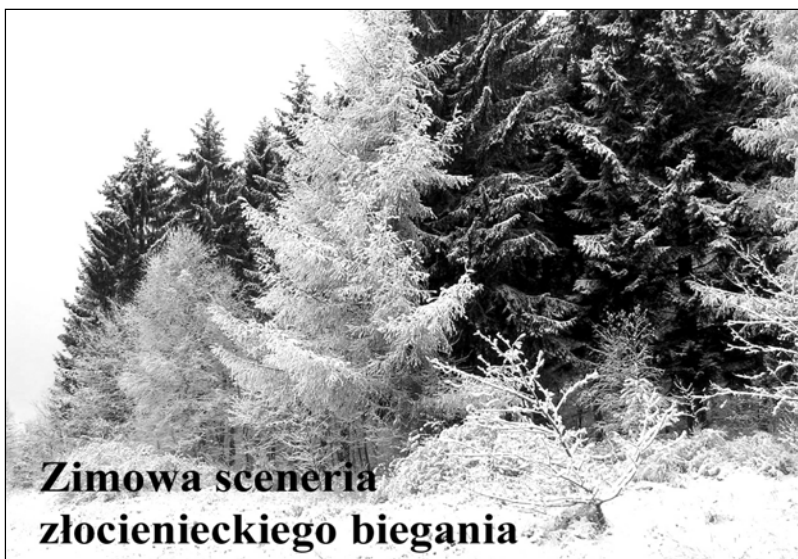
Zimowa sceneria złocienieckiego bieganina