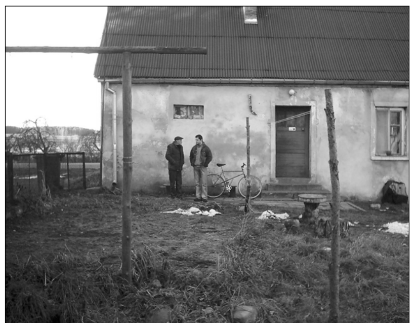
Czy na polskiej wsi może być lepiej?