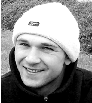
Cezary z Drawska Pom.

Było bardzo dużo fajnych rzeczy, żyjemy z dziewczyną w rozłące, budujemy się w Goleniowie. Chciałbym wybrać się jeszcze do szkoły, ale z tym to różnie bywa. Na święta spodziewam się prezentów. Czasami gram w totolotka. Na następny rok planujemy ślub. Najważniejsza jest dla mnie przeprowadzka. Myślę, że nie będę żałował, że nie mieszkam w Drawsku Pom. Myślę, że w Goleniowie będę miał większe możliwości.