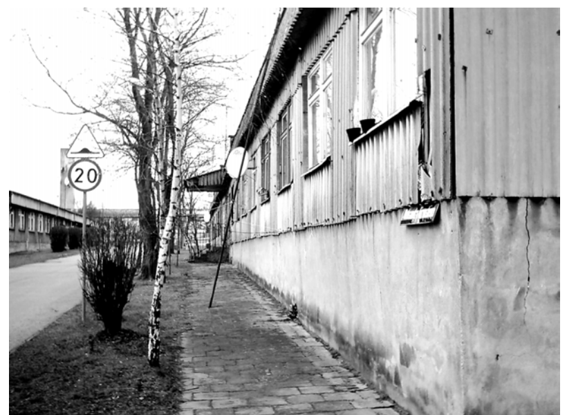
Widok na barak przy ul. Gierymskiego 2