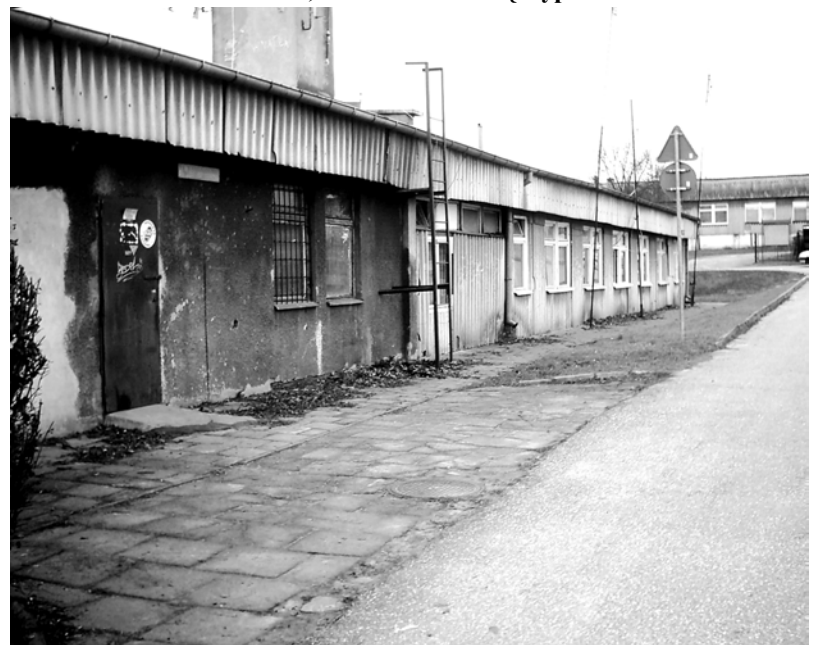
W tym baraku mieszkają ludzie ul. Gierymskiego 1