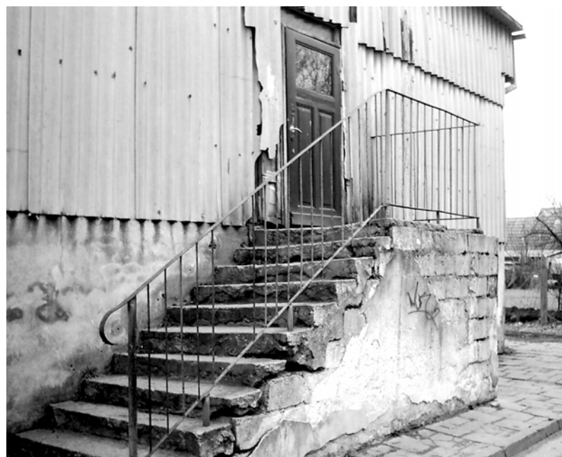
Wejście do baraku