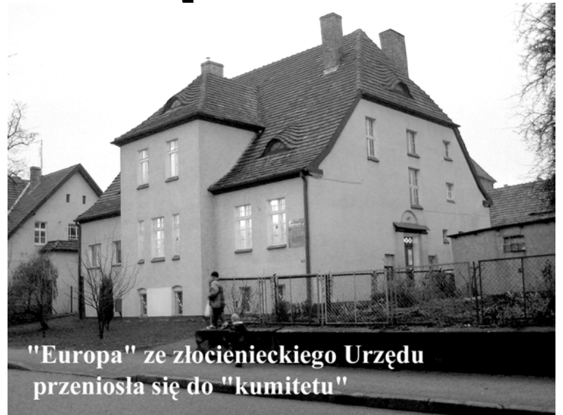
"Europa" ze złocienieckiego Urzędu przeniosła się do "kumitetu"