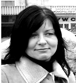
Edyta z Goleniowa

Było bardzo dużo fajnych rzeczy, żyjemy z dziewczyną w rozłące, budujemy się w Goleniowie. Chciałbym wybrać się jeszcze do szkoły, ale z tym to różnie bywa. Na święta spodziewam się prezentów. Czasami gram w totolotka. Na następny rok planujemy ślub. Najważniejsza jest dla mnie przeprowadzka. Myślę, że nie będę żałował, że nie mieszkam w Drawsku Pom. Myślę, że w Goleniowie będę miał większe możliwości.