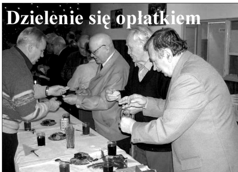
Dzielenie się opłatkiem

Informujemy Szanownych Czytelników, że od Nowego Roku nasza gazeta będzie ukazywała się w każdy czwartek tygodnia.