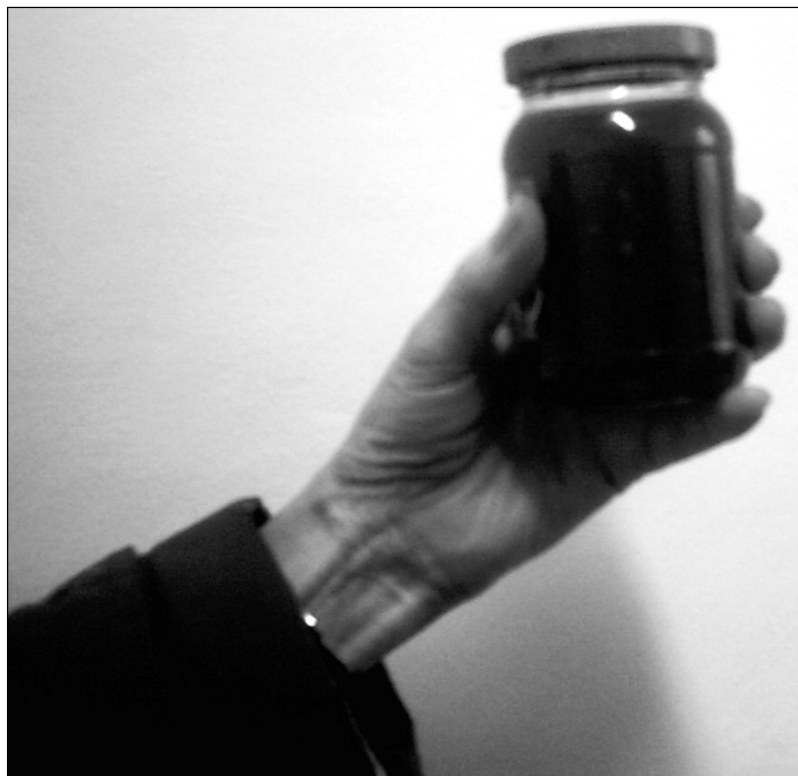
Taka woda leci z kranu w Drawsku Pomorskim - Mieszkańcy są oburzeni.

Mieszkańcy są w tym momencie niepokieszeni. Nie mogą się kąpać, myć, prać, gotować. Podczas prania niszczone są ubrania, pralki. Na dzień dzisiejszy władze spółdzielni chcą, aby próbki wody zbadała Powiatowa Stacja Sanitarno-Epidemiologiczna w Drawsku Pom. Red.