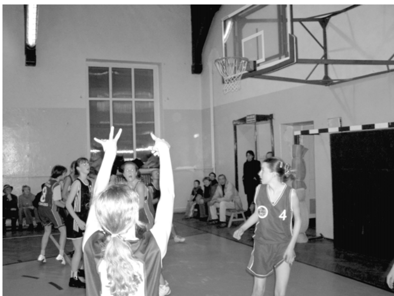
Czy młodzież z Drawska Pomorskiego będzie miała równe szanse?

by pierwszego stycznia roku 2005, a więc już za kilka dni, mróz tak ściął murawę na obiekcie Olimpu, że rozegranie na niej meczu piłkarskiego nie zaszkodziłoby jej, to tego dnia o godzinie 13.00 szeroka kadra Olimpu Złocieniec w pierwszym boju piłkarskim Nowego Roku rozegra mecz z oldbojami. (n)