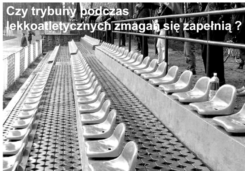
Czy trybuny podczas lekkoatletycznych zmagania się zapełnią ?

wym. Trenowaliśmy tam, by solidnie przygotować się do startów. Mój sportowiec to Adam Małysza. Otylia Jędrzejczak. Robert Korzeniowski też, ale nie za bardzo. Uczę się od tych wielkich sportowców wytrzymałości. Zapatrzenie się w nich zachęca do uprawiania sportu. Też myślę o tym, aby kiedyś pokazać się, błysnąć. Zostać zauważoną. -