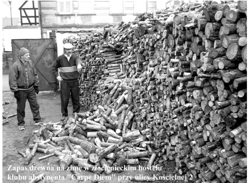
Zapasy drewna na zimę w złocienieckim hostelu klubu abstynenta "Carpe Diem" przy ulicy Kościelnej 2

(ZŁOCIENIEC) Czynny jest tutaj staraniem Stowarzyszenia Carpe Diem i władz gminy hostel dla bezdomnych. Gwarantuje za miesięczną opłatą 100 złotych miejsce noclegowe, ciepłą kąpiel raz w tygodniu i możliwość przyrządzania posiłków we wspólnej kuchni.