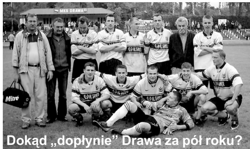
Dokąd „dopłynię” Drawa za pół roku?

Ps. Zapraszamy na nasze łamy wszystkich Czytelników i pasjonatów sportu, nie tylko futbolu, do podzielenia się swoimi obserwacjami, uwagami, opiniami na ten oraz inne tematy.