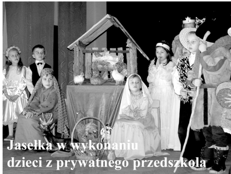
Jasełka w wykonaniu dzieci z prywatnego przedszkola

Jeżeli można, teraz chciałbym podać kilka istotnych danych na temat budżetu gminy Złocieniec za rok 2004. Rozliczenie mojej pracy za rok miniony, to będzie przecież także rozliczenie z realizacji budżetu.