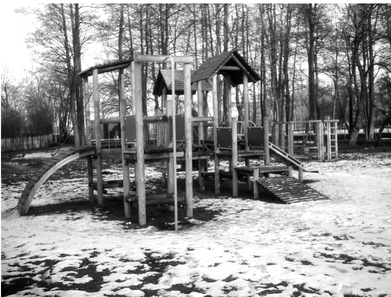
Plac zabaw w Parku Chopina.

Miejscowość Grom leży w województwie warmińsko-mazurskim.