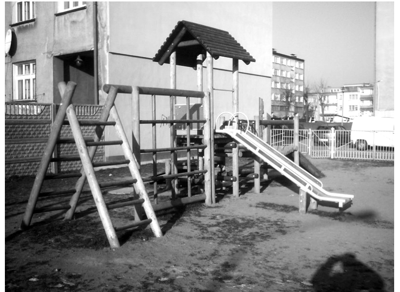
Plac zabaw przy ul. 11 Pułku Piechoty.