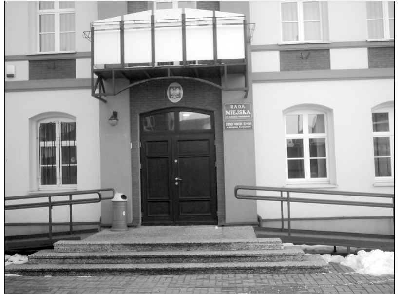
Urząd Miasta i Gminy w Drawsku Pomorskim

Odpowiedź burmistrza: Zgodnie z ustawą z dnia 12 grudnia 1997r. o dodatkowym wynagrodzeniu rocznym dla pracowników jednostek sfery budżetowej (Dz. U. Nr 160,