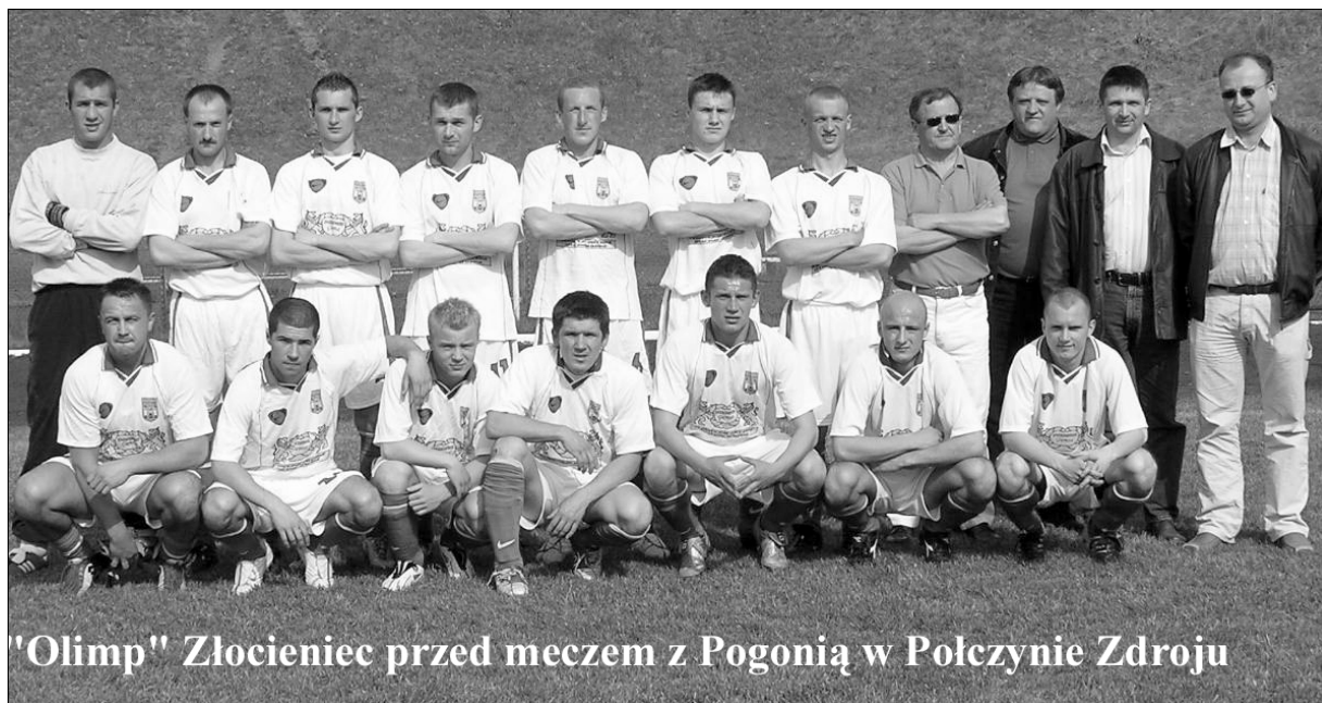
"Olimp" Złocieniec przed meczem z Pogonią w Połczynie Zdroju