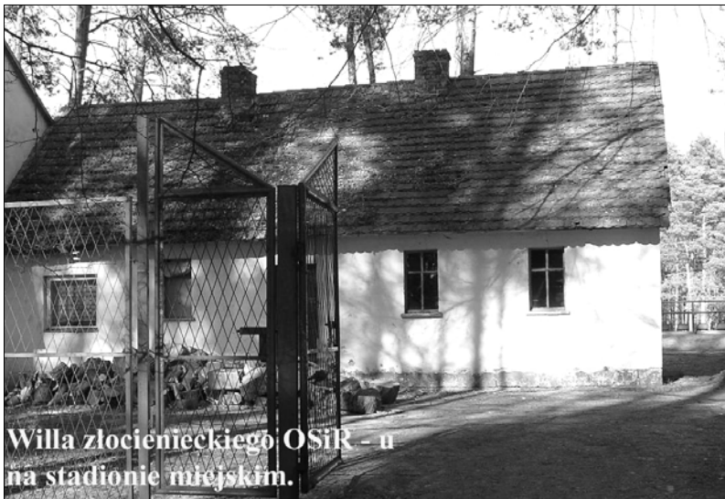
Willa złocienieckiego OSiR - u na stadionie miejskim.

- SZALET NA MINUSIE, ETATYZACJA NA PLUSIE