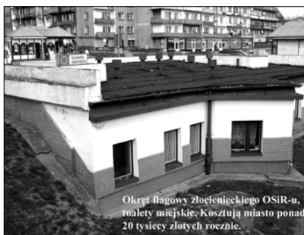
Okręt flagowy Złocienieckiego OSiR-u, toalety miejskie. Kosztują miasto ponad 20 tysięcy złotych rocznie.

Szalet miejski i parking to same deficyty. W 2003 roku minus 20.000,10 złotych. Rok temu deficyt 21.228,32 złote. Tu dodajmy, że