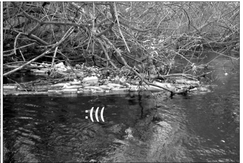
Zdjęcia pochodzą od różnych osób, które prosiły nas o uczulenie władz w temacie, twierdząc, że takie wizytówki nie są gminie w ogóle potrzebne.