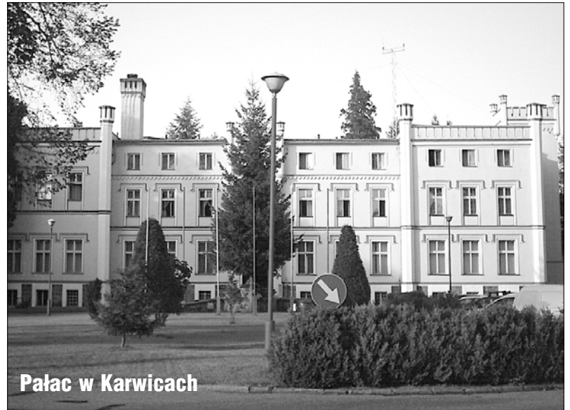
Pałac w Karwicach