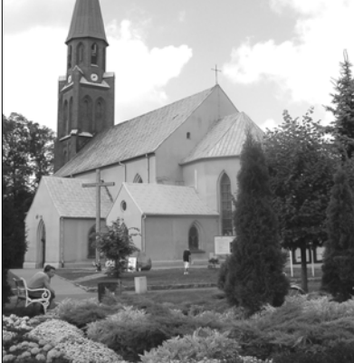
Kościół pod wezwaniem Wniebowzięcia Najświętszej Maryi Panny w Złocieniu