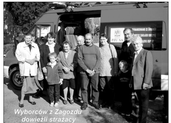
Wyborców z Zagozdu dowieźli strażacy

(KRAJ, POWIAT) Nie udało się wyłonić prezydenta Rzeczypospolitej w pierwszej turze wyborów, kolejna tura wyborów odbędzie się 23 października, a wybierać będziemy spośród dwójki pretendentów do objęcia tego urzędu, którzy w pierwszej turze uzyskali największą liczbę głosów. Z oficjalnych wyników podawanych przez Państwową Komisję Wyborczą wynika, że za niespeł-