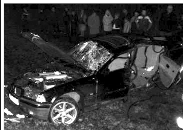
6.11.2005 - wypadek drogowy w miejscowości Złocieniec. W wyniku wypadku 1 osoba poniosła śmierć na miejscu a 4 zostały ranne.