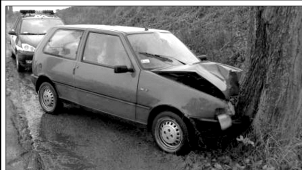
15.11.2005 - wypadek drogowy na trasie Czaplunek - Czarne Małe. W wyniku wypadku 1 osoba została ranna.