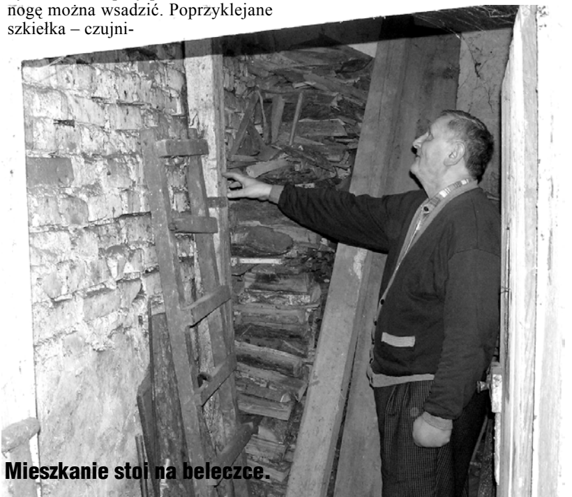
Mieszkanie stoi na beleczce.

Ten budynek to jedyna na tym odcinku poniemiecka pozostałość na brzegu Drawy. Wyróżnia się na całą okolicę ładną architekturą. Niedługo zgnije zupełnie. Dobrze, można się nawet na to zgodzić, choć i to ciężko. Ale, w tym budynku mieszkają ludzie, nie można im gotować losu takiego, jak i budynkowi. To brzmi mocno, ale w życiu dwojga ludzi na brzegu Drawy w pobliżu Stacji na ulicy 11 Listopada jest jeszcze gorzej, niż z budynkiem, bo to ludzie żywi. Jeszcze, do licha. Tadeusz Nosel