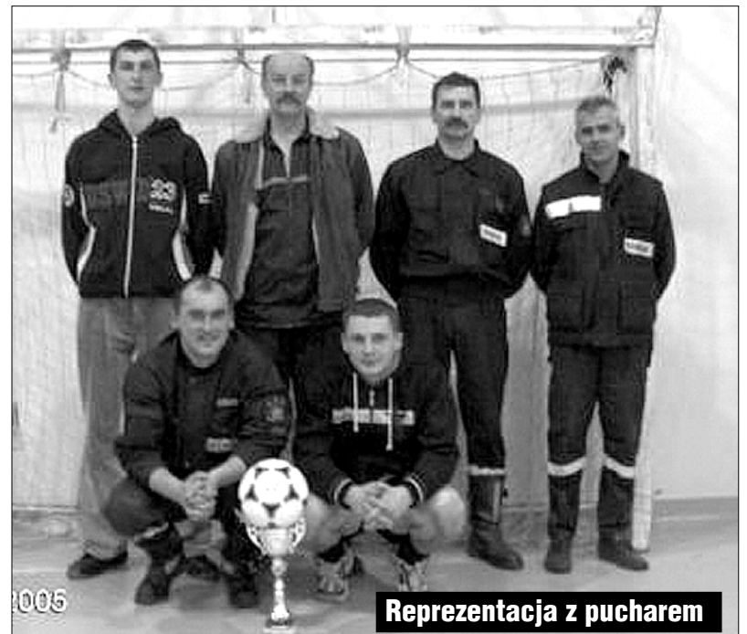
Reprezentacja z pucharem

Serdecznie gratulujemy i liczymy na obronę tytułu w przyszłym roku.