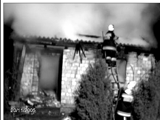
20.11.2005 - nocny pożar domku letniskowego w miejscowości Złocieniec. W wyniku pożaru budynek uległ całkowitemu spaleniu.