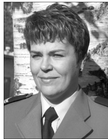
Sporządziła st. sierż. Anna Młynarczyk. Tytuły od redakcji.

(ZŁOCIENIEC) 24.11.br. o godz. 23:40 w Złocieniu, przy ul. Piaskowej, nieustalony sprawca, po uprzednim wyważeniu drzwi wejściowych, włamał się do sklepu "Las i Ogród", gdzie usiłował dokonać kradzieży różnego rodzaju mienia. Sprawca zamierzonego celu nie osiągnął, ponieważ został spłoszony przez załączenie się alarmu, przy czym należy dodać, że zagrożone zostało mienie o wartości 30.000 zł należące do 33-letniego mieszkańca Czaplinka.