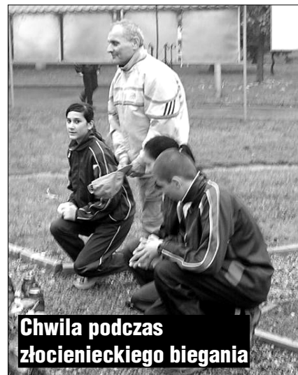
Chwila podczas złocienieckiego biegania