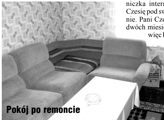
Pokój po remoncie

„Czesia, zostaw to, zostaw to, bo ty już tu nie wytrzymujesz.”