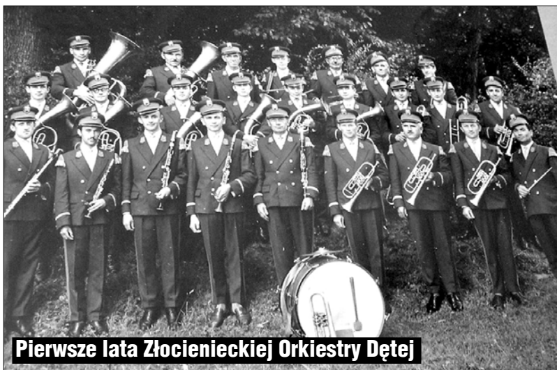
Pierwsze lata Złocienieckiej Orkiestry Dętej

Jego Matce, naiwność, z jaką nasz polski i wiejski świat przynosi się w odległe wieki i kraje. I tak ktoś, kto dzieje Nowego Testamentu znałby tylko z kolęd, mógłby pomyśleć, że Pan Jezus urodził się gdzieś w jakiejś polskiej wsi.