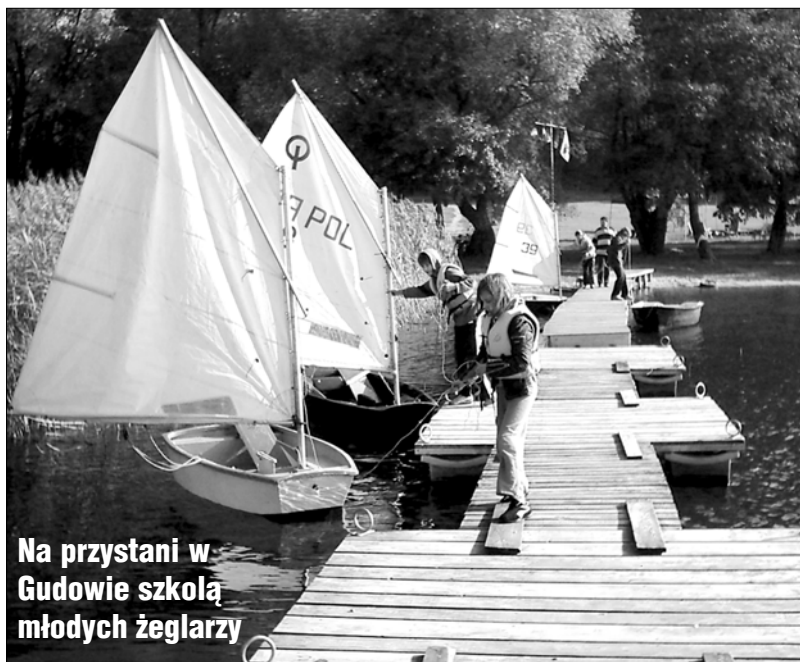
Na przystani w Gudowie szkoła młodych żeglarzy

(ZŁOCIENIEC) Już w gminie ogłoszono konkursy na prowadzenie zajęć sportowych w tym roku. Wymieńmy je: a/ organizacja zajęć sportowych w zakresie piłki nożnej dla dzieci, młodzieży i osób dorosłych.