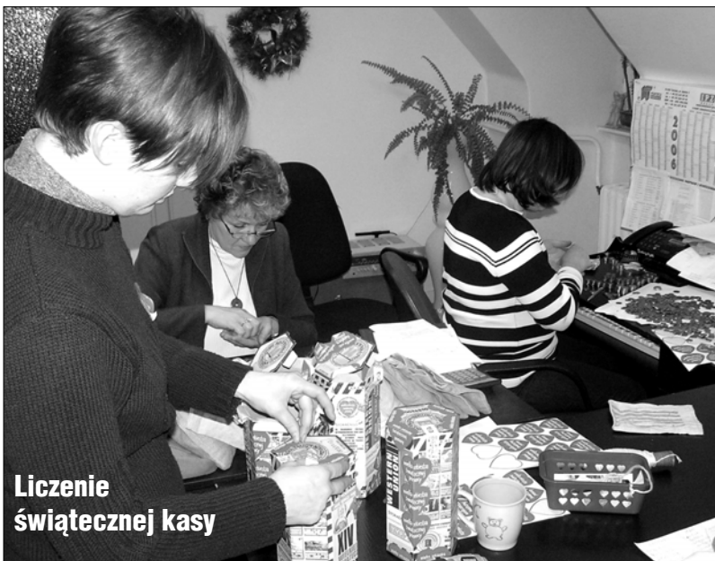
Liczenie świątecznej kasy