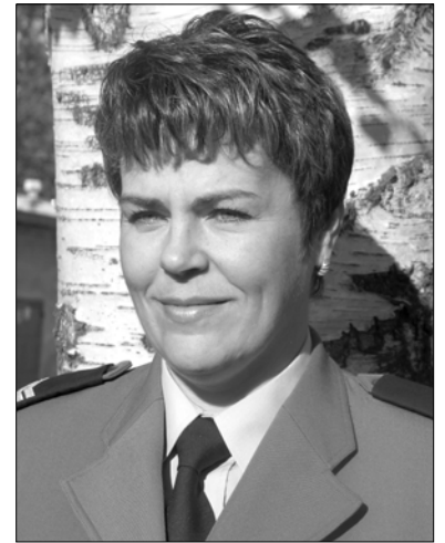
Sporządziła st. sierż. Anna Młynarczyk. Tytuły od redakcji.

(DRAWSKO POM.) 6 bm. o godz. 17:40 w Drawsku Pom. nieustalony sprawca, po uprzednim wygięciu metalowego skobla przy drzwiach wejściowych, włamał się do pomieszczenia piwnicznego, skąd następnie dokonał kradzieży 4 szt. felg aluminiowych wraz z oponami. Pokrzywdzona 36-letnia mieszkanka Drawsko Pom. poniosła straty na kwotę 1200 zł.