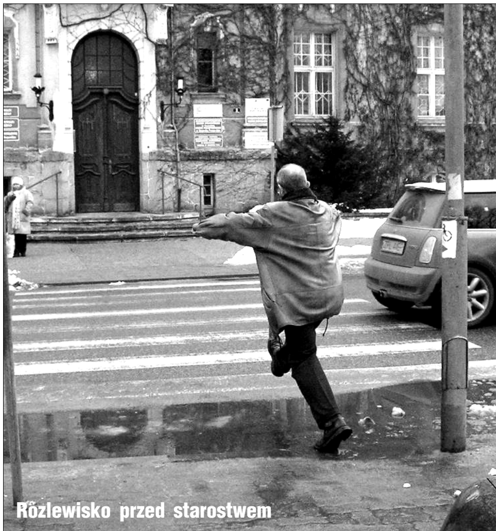
Różlewisko przed starostwem