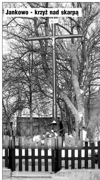
Jankowo - krzyż nad skarpią