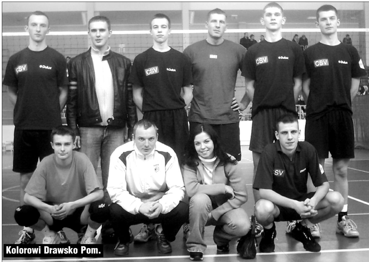
Kolorowi Drawsko Pom.

Zebrał chłopaków i zaczęli trenować. Niektórzy wcześniej grali w „Olimpijczyku”, inni w szkole w Gogólczyńcu. Najgorzej jak się coś lubi w szkole, a po jej ukończeniu nie ma już możliwości dalszego uprawiania ulu-