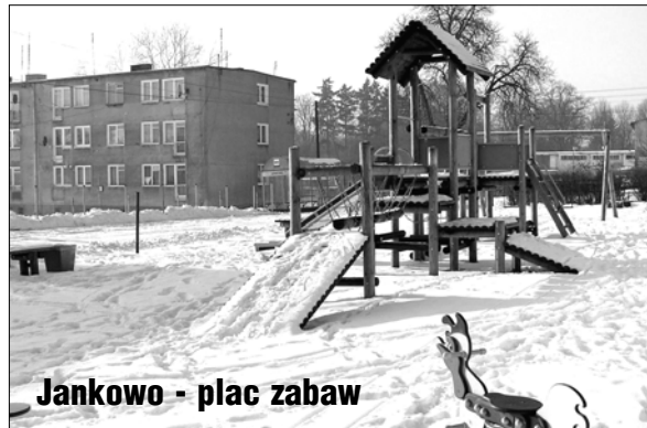
Jankowo - plac zabaw