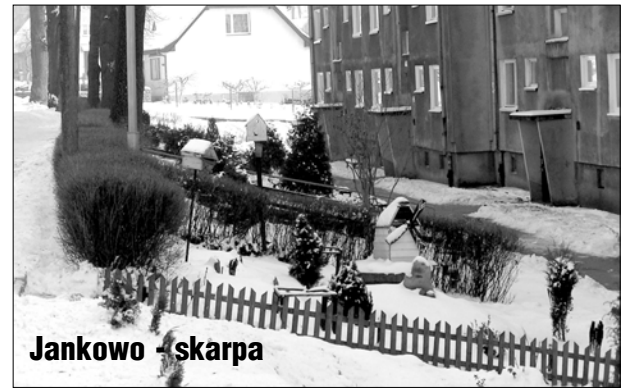
Jankowo - skarpią

zmarnuje. Pod tym względem jestem zadowolony i dumny z naszych mieszkańców. Niekiedy co prawda występują jakieś tam animozje, ale to jak w każdej rodzinie. Sołtysiem jestem już trzecią kadencję. Innym przykładem dbania o otoczenie jest budowa płotu. Można zobaczyć jak wyglądał stary płot przy blokach, a jak będzie wyglądał nowy. Już przygotowano słupki a siatka będzie zakładana na wiosnę. Podobnie sprawa ma się z chodnikami, które będą gruntownie remontowane. -