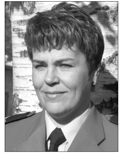
Sporządziła st. sierż. Anna Młynarczyk. Tytuły od redakcji.

(BRO CZYNO) 5.03.2006r. o godz. 22:00 w miejscowości Broczyno, gm. Czaplinek, kierująca samochodem osobowym marki Opel Corsa 33-letnia mieszkanka powiatu kołobrzесьkiego na łuku drogi, w trakcie mijania ciągnika siodłowego marki DAF, uderzyła w ciągniętą przez niego naczepę, w wyniku czego doznała obrażeń obu kolan, a jej 6-letnia córka ogólnych potłuczeń i obrażeń głowy. Poszkodowane przewiezione zostały do Szpitala Wojskowego w Wałczu.