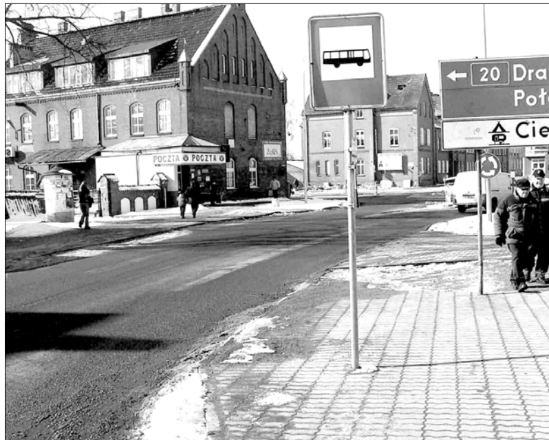
pojemnej dziurze w jezdni na ulicy Adama Mickiewicza tuż przy ledwie