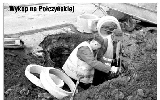
Wykop na Połczyńskiej

I na koniec godzinnej wędrowki po miasteczku: burza z piorunami w nocy z poniedziałku na wtorek doszczętnie zmyła resztki zimy, czyli śniegu. Odsłoniła tenisowe korty Między Mostami, także ścianę do treningów tej pięknej gry. Z kortów będzie można korzystać za parę, ale dłuższych już znacznie dni. Na ścianę będzie można przyjść lada moment. Także, by pod chmurką pograć w kosza. A wydawało się jeszcze wczoraj, że zima tego roku kresu nie dobiegnie nigdy. (n)