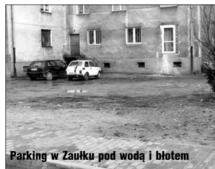
Parking w Zaułku pod wodą i błotem

Tuż, tuż - ulica Zaułek wychynęła spod śniegu i lodu. Okazuje się, że ubiegłoroczny remont pozostawił po sobie dobre, jak na Złocieniec, chodniki z polbruku.