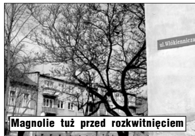
Magnolii tuż przed rozkwitaniem

U zwieńczenia budynku nieczynny zegar, jakby ciągle czekał na kogoś. Oby się nie doczekał! U boku budynku stylizowany pawilonik handlowy PSS Jutrzenka, z ozdobami na wzór "złocienieckiej cegły" i w jej kolorystyce. Na pierwszym planie jednak Pomnik - Chwała Poległym. Tym, którzy przy boku Armii Radzieckiej zdobywali te ziemie, ale przez długi czas nie mogli pozbyć się drugiego okupanta, współzdobycy miasta.