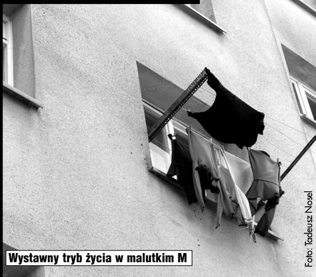
Wystawny tryb życia w małutkim M