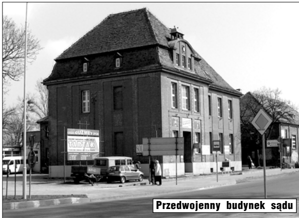
Przedwojenny budynek sądu

Pod samą Poczta nowy chodnik już dobrze służy przechodniom. Wzdłuż ulicy także i tutaj jest długie miejsce na pas zieleni, kwiatów.