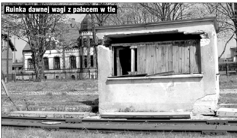
Ruinka dawnej wagi z pałacem w tle

Pierwszy z tych punktów, to zima, z jaką mieliśmy do czynienia na dworcu, choć, co prawda, mamy już wiosnę. Śniegu w tym roku nie mieliśmy w nadmiarze, ale od początków opadów do ich końca ani razu spod dworca PKP nikt nie wywiózł zwałów opadów. Później przekształciły się w skały lodu. Przeszkadzały nie tylko w ruchu kołowym, ale także pieszym, gdyż musieli kluczyc tam nie tylko między samochodami, ale i pośród zwałowisk lodu. Proszę z wyprzedzeniem, aby kolejna zima tak nie zaskoczyła gospodarzy miasta, jak to miało miejsce na przełomie roku minionego z obecnym.