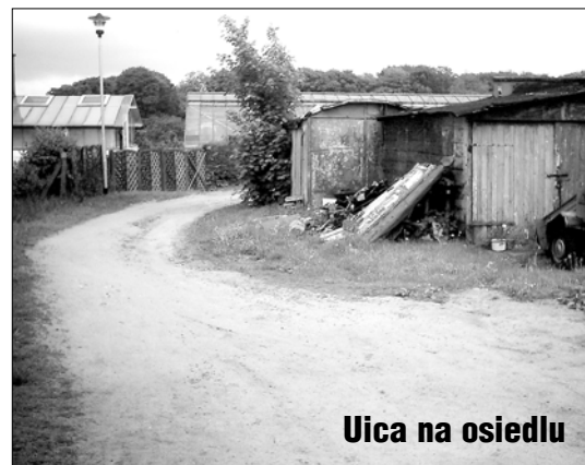
Ulica na osiedlu