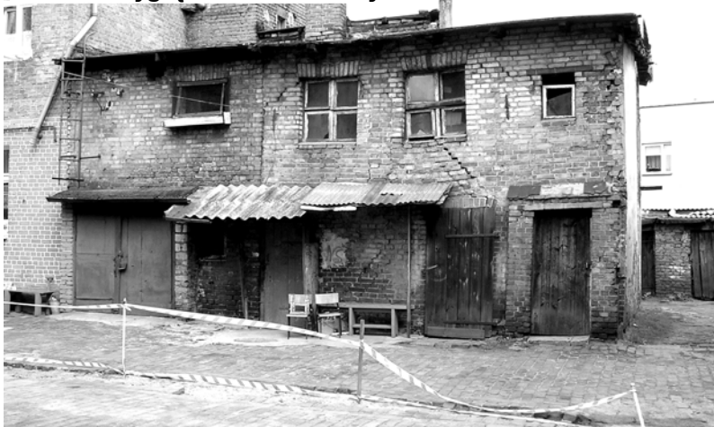
A tak to wygląda nieładnie z tyłu

- Stanisława Staszica. Ciekawe, czy któryś z radnych powiatowych Drawska Pomorskiego, cokolwiek wie o tym człowieku. Gdyby wiedział, ta ulica wyglądałaby zupełnie inaczej. Tam też są ruiny o wartości historycznej.