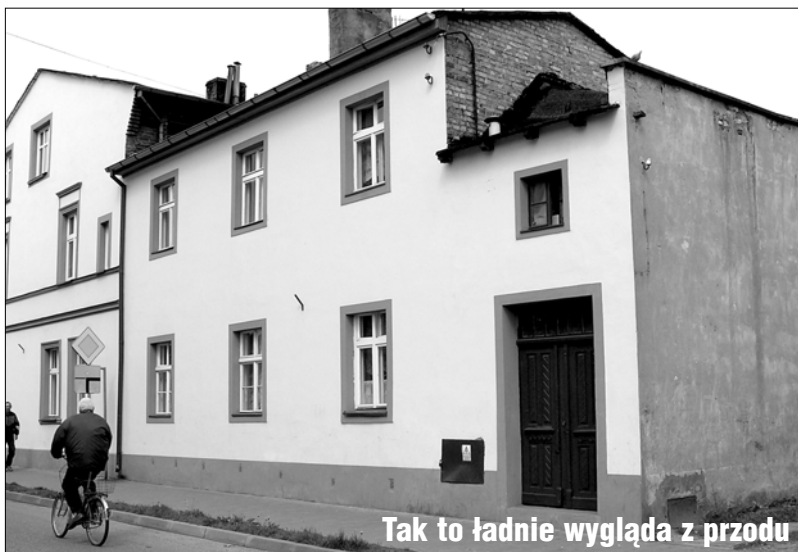
Tak to ładnie wygląda z przodu

(ZŁOCIENIEC) W Spichlerzu można oglądać Złocieniec na fotografiach. Ktoś powiedział, że jest to Złocieniec "ładny". Słowo "ładny" nie jest słowem dobrym. Nic nie mówi. Niczego nie otwiera. Nie jest kluczem, wytrychem.