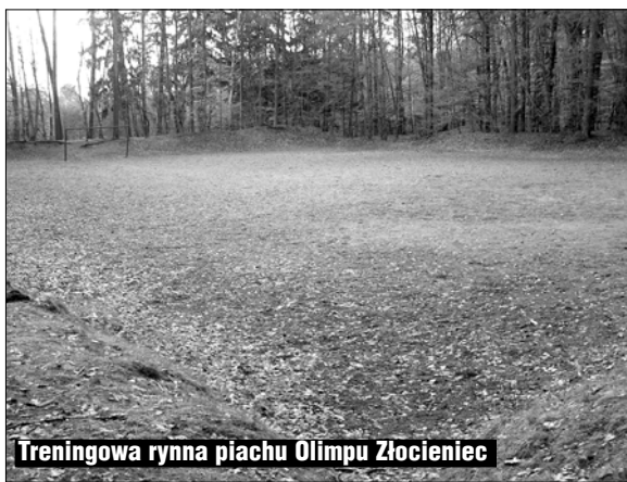
Treningowa ryjna piachu Olimpu Złocieniec

(ZŁOCIENIEC) Przy ulicy Połczyńskiej, tuż za cegielnią ZAMKOWA, a obecnie kościołem pw. Świętej Jadwigi, nawożona jest ziemia na działkę, na której niedługo ma się rozpocząć budowa nowoczesnego motelu. Działka kilka miesięcy temu została sprzedana jednej z najbardziej znanych firm złocienieckich.