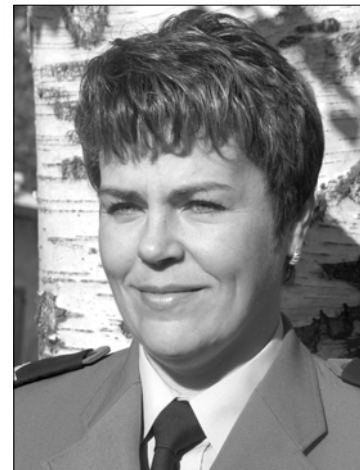
Sporządziła st. sierż. Anna Młynarczyk. Tytuły od redakcji.

(ZŁOCIENIEC) 6 czerwca br. na drodze publicznej Siecino-Złocieniec kierująca samochodem osobowym marki Nissan Primera mieszkanka Złocienia, na prostym odcinku drogi, z nieustalonych przyczyn zjechała na lewą stronę jezdni i uderzyła czołowo w przydrożne drzewo. W wyniku tego zdarzenia doznała złamania żeber oraz ogólnych potłuczeń.