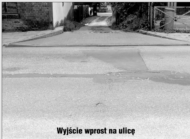
Wyjście wprost na ulicę

(ZŁOCIENIEC) Łącznik między kortami tenisowymi nad Wąsawą i ulicą Trzeciego Pułku Piechoty wychodzi wprost na tę ulicę. Tygodnik był proszony, by zasygnalizować potrzebę namalowania w tym miejscu pasów dla pieszych, gdyż często sportowcy, w tym i dzieci, z łącznika gwałtownie wychodzą na jezdnię. Na szczęście nie odnotowano jeszcze żadnego poważnego wypadku. Pora na pasy i to jak najszybciej. (t)