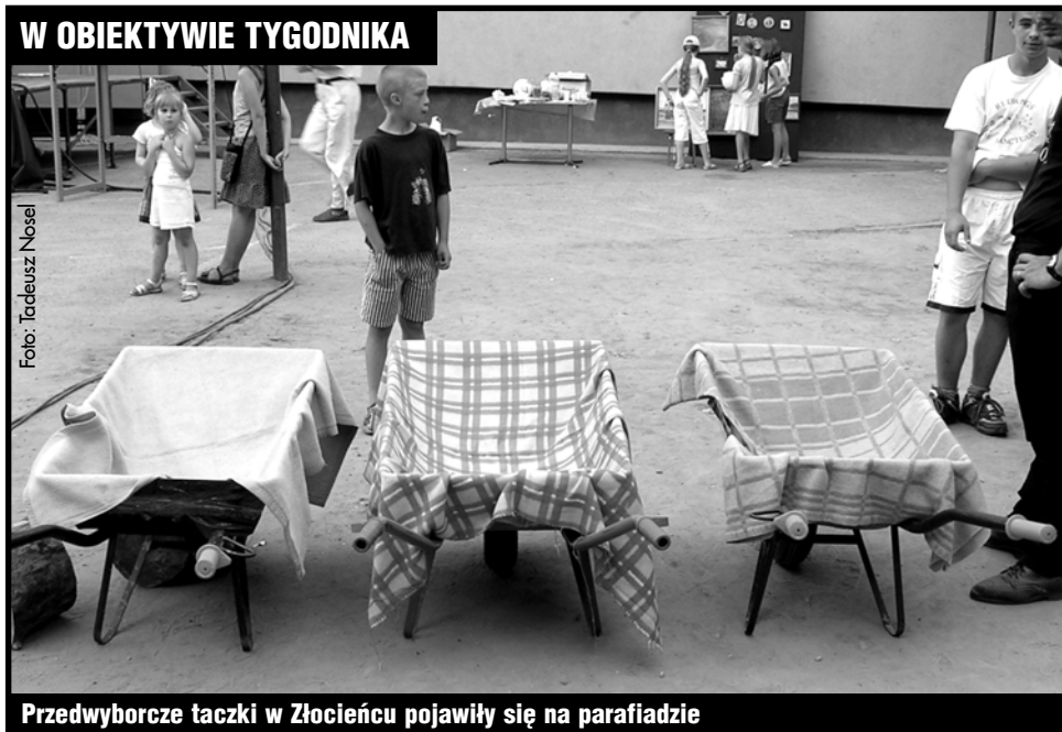
Przedwyborcze taczki w Złocięncu pojawiły się na parafiadzie