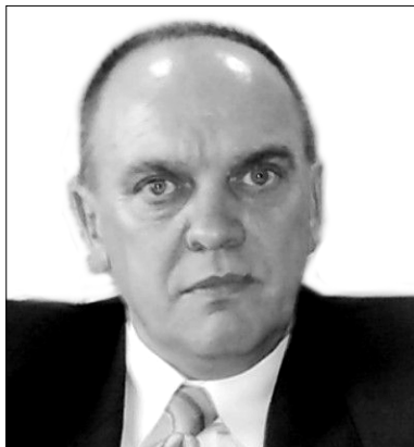
Burmistrz Drawska Pomorskiego Zbigniew Ptak

Do majątku nieruchomości burmistrza Zbigniewa Ptaka należy do o powierzchni 64,5 metrów kwadratowych, wyceniony na 96750 zł, 37 – metrowe mieszkanie, warte 97 tys zł, połowa działki o powierzchni 2435,50 metrów kwadratowych, warta wraz ze stojącym na niej 60 – metrowym budynkiem gospodarczym 66 tys zł. Oszczędności burmistrza to 1061,71 zł. Najmowanym przez siebie stanowisku Zbigniew Ptak zarobił w ubiegłym roku 116.846,80 zł. W oświadczeniu zamieścił również ubiegłoroczne dochody żony, wynikające z tytułu umowy o pracę w wysokości 34.137,72 zł. Burmistrz Ptak jeździ samochodem Ford Focus z 2003 roku, na którego zakup zaciągnął kredyt bezgotówkowy w PKO BP na kwotę 60500 zł (termin spłaty – 1 czerwiec br.). Burmistrz zobowiązany jest również do spłaty kredytu mieszkaniowego zaciągniętego w tym samym banku na kwotę 105000 zł (termin spłaty – 1 wrzesień 2028 roku). Cały majątek burmistrza, wraz z dochodami jest współwłasnością jego małżonki.