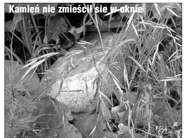
Kamień nie zmieścił się w oknie

(ZŁOCIENIEC) To "coś" stoi na Stolarskiej w Złocieńcu. W kształcie budynku. Część niezamieszkała, podobno, bo tu się wszystko wali – mówią tam. Tylko nieliczne okna z szybami. Inne wytłuczone. Drzwi od klatki zamknięte. Schody rozświetlone w słońcu tak intensywnie, że pojawiająca się na nich kobieta nie sprawia niedobrego wrażenia. Wszystko w jasności. Niepomalowane schody, bieda, ludzki kac, bezzębnie wypowiedane słowa.