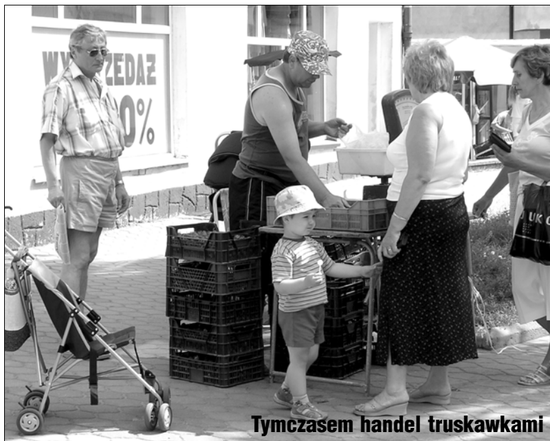
Tymczasem handel truskawkami

Tymczasem informujemy, że rusza skup kwiatu bzu czarnego. Z tego surowca wytwarza się niezastąpione leki. Miejsce skupu przy ulicy Podmiejskiej 20. Tuż przy plebani. Codziennie od godziny 10.00 do 18.00. Podamy też telefon – 888 423 809.