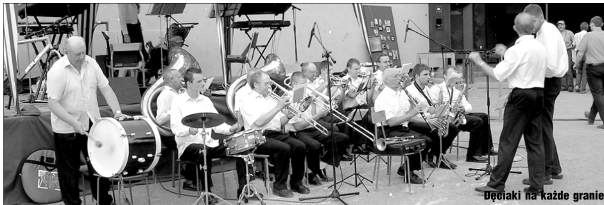
Dęciaki na każde granie

DALEJ TO ZABAWY POZAPILKARSKIE: loteria z losowaniem głównej nagrody, zabawy dla dzieci, konkurencje dla małżeństw, pokaz psów rasowych, walk karate, aukcja