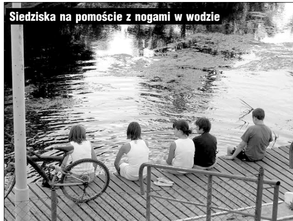
Siedziska na pomoście z nogami w wodzie