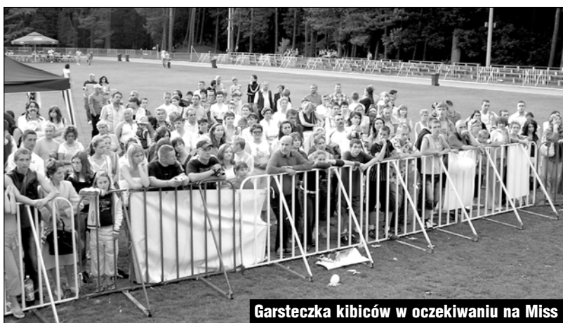
Garsteczka kibiców w oczekiwaniu na Miss