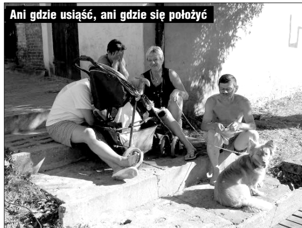
Ani gdzie usiąść, ani gdzie się położyć

nowiskach dyrektorzy i prezesi, księgowi, całe watahy urzędników. Dlatego ławeczki nad Drawą nie uświadczysz. I nawet przywoływanie w tej sprawie wielkiego Imienia, na nic się chyba zda. A już z w pobliskim Czaplunku na brzegu jeziora jest zupełnie inaczej. Czyściutko, z niezliczoną liczbą ławeczek, brzegi cudnie umocnione kamieniami. O tym poinformował nas starszy pan, który z małżonką poruszającą się o kuli na spacerze jeździ do Czaplunka - by odpocząć od Złocienia - powiedział. (n)