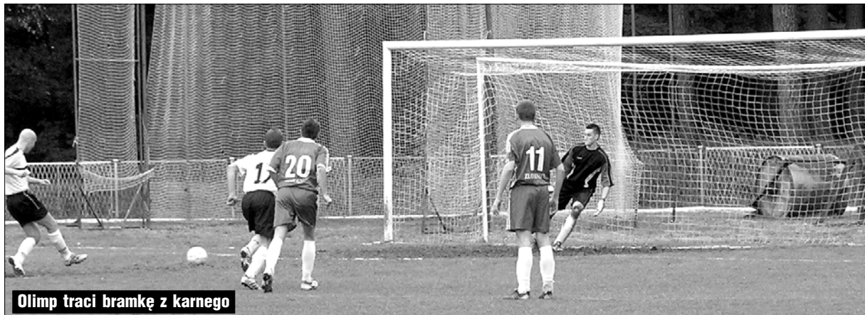
Olimp traci bramkę z karnego

(ZŁOCIENIEC). Trzeci mecz z rzędu przegrał Olimp Złocieniec. Tym razem, znów u siebie, z Głazem Tychowo - 2:3. Tydzień temu na wyjeździe z Drzewiarzem 1:2. Dwa tygodnie temu z Lechem Czaplnek 0:1. U siebie.