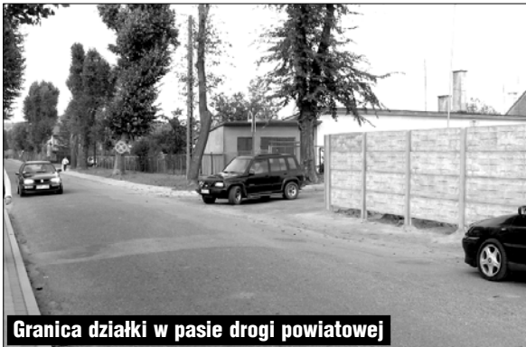
Granica działki w pasie drogi powiatowej