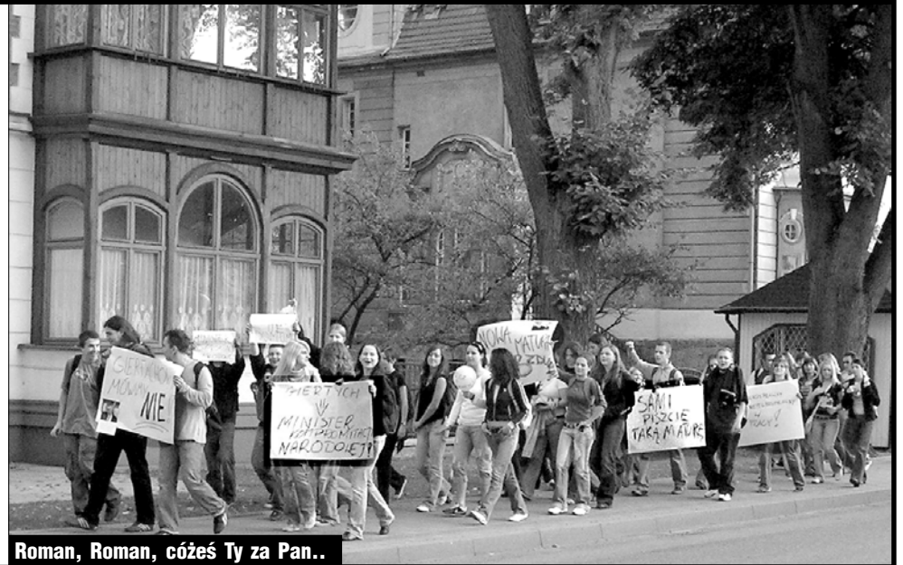
Roman, Roman, cóżes Ty za Pan..