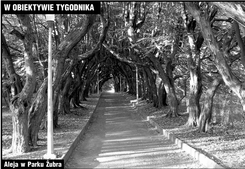
Aleja w Parku Żubra