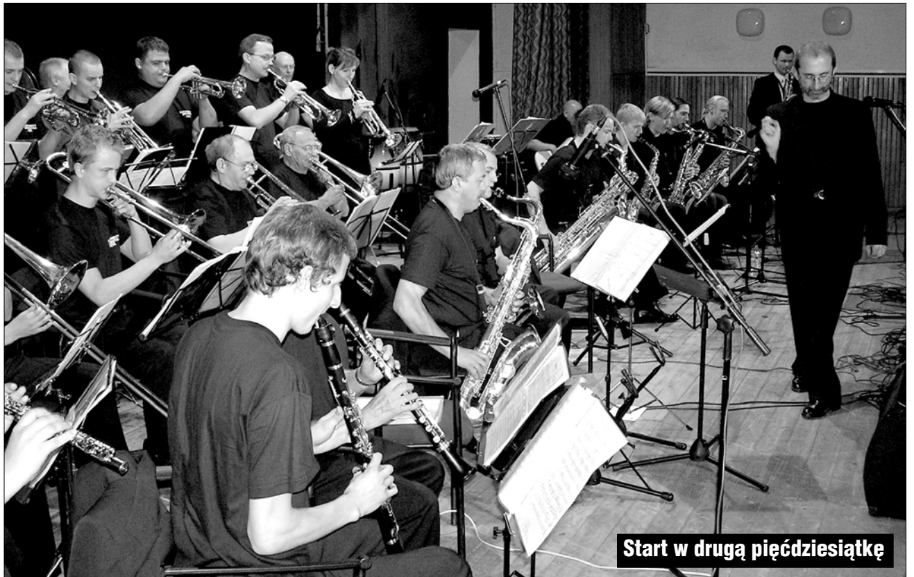
Start w drugą pięćdziesiątkę

Złocieniecka Orkiestra Dęta jest zespołem amatorskim. Pierwszym patronem Orkiestry były niegdysiejsze Zakłady Przemysłu Wełnianego, będące wówczas największym złocienieckim zakładem produkcyjnym. Członkowie Orkiestry rekrutowali się nie tylko z macie-