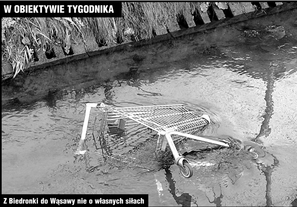
Z Biedronki do Wąsawy nie o własnych siłach