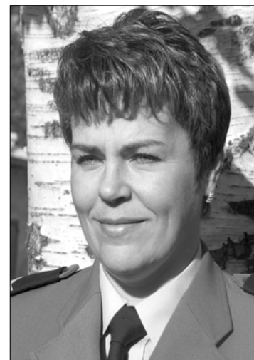
Sporządziła mł. asp. Anna Młynarczyk. Tytuły od redakcji.

(RZĘŚNICA) 1 grudnia o godz. 21:00 w miejscowości Rzęśnia, policjanci prewencji zatrzymali 28-letniego mieszkańca gminy Złocieniec podejrzanego o dokonanie kradzieży kolejowej linii telekomunikacyjnej w ilości 500 mb. Pokrzywdzony Telekomunikacja PKP w Szczecinie oszacowała straty na kwotę około 10.000 zł.