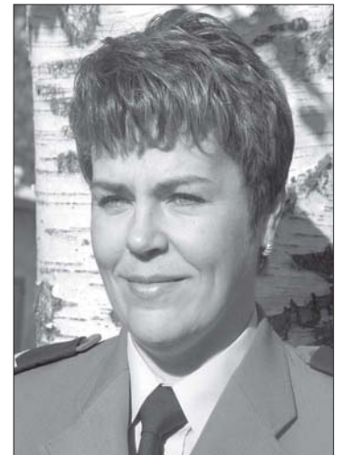
Sporządziła mł. asp. Anna Młynarczyk. Tytuły od redakcji.

(DRAWSKO POM.) W dniu 7.12.2007r. o godz. 06:45 w Drawsku Pom., przy ul. Tatrzańskej, nieustalony sprawca, po uprzednim wyłamaniu drzwi balkonowych wszedł do domku jednorodzinny, gdzie dokonał kradzieży biżuterii oraz alkoholu. Pokrzywdzona mieszkanka Drawska Pom. oszacowała straty na łączną kwotę 1000 zł.