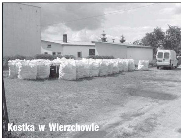
Kostka w Wierchowiu