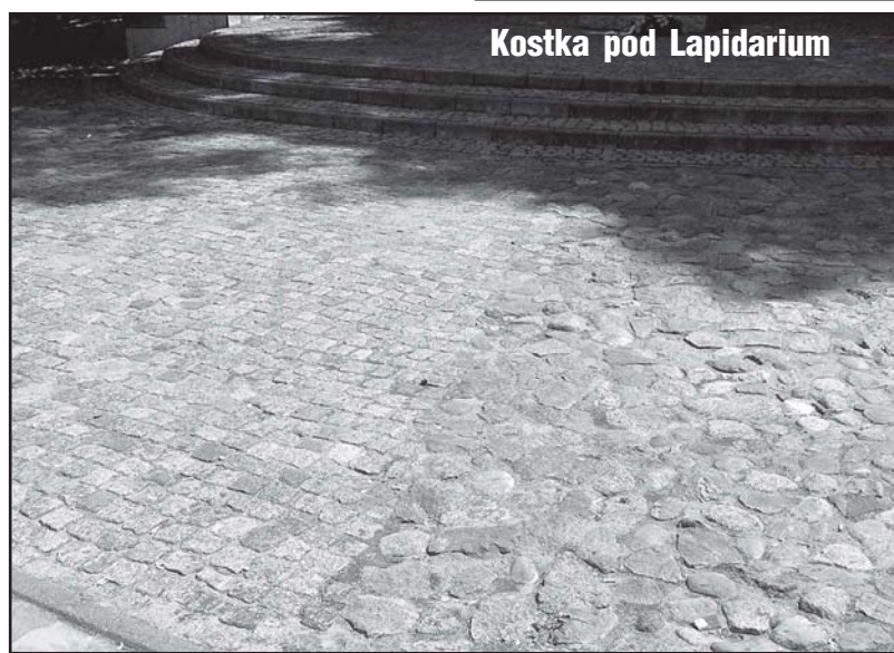
Kostka pod Lapidarium