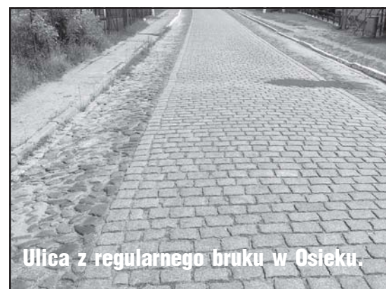
Ulica z regularnego bruku w Osieku.