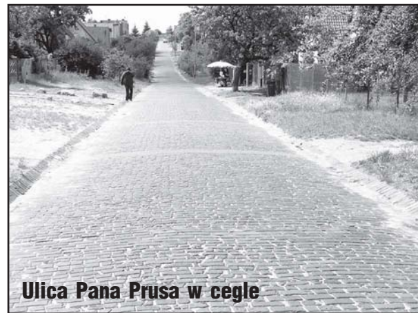
Ulica Pana Prusa w cegle