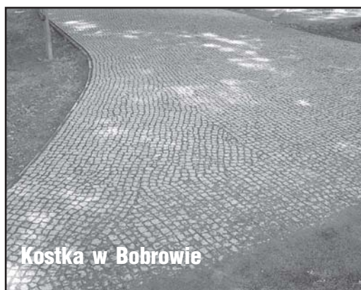
Kostka w Bobrowie