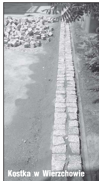
Kostka w Wierchowiu

Inny rodzaj, też zabytek, wyłożenia ulicy w Osieku. Kamienie brukowe regularnie przysposobione. Dosłownie - wspaniałość. Czyli na początku minionego wieku na tych terenach wiedzano, jak się wykonuje dukty, by służyły mieszkańcom. Minął wiek - i co...?. Granitem nieregularnym w ludzi? (t)