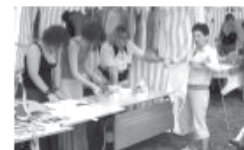
Cała lista sponsorów na stronie miejscowości