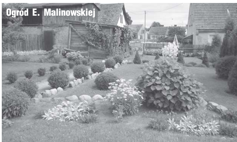
Ogród E. Malinowskiej

POLICEALNA SZKOŁA DETEKTYWÓW I PRACOWNIKÓW OCHRONY O'CHIKARA